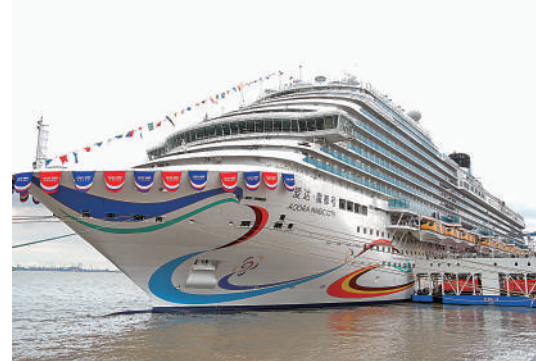
▲2023年11月4日，國產首艘大型郵輪「愛達·魔都號」命名交付。

在航天及天文探索方面，中國首次火星探測火星全球影像圖發布入選。2023年4月，國家航天局和中國科學院聯合發布了中國首次火星探測火星全球影像圖，將為開展火星探測工程和火星科學研究提供質量更好的基礎底圖，為人類深入認知火星作出中國貢獻。全球最大射電天文望遠鏡陣列首台中頻天線正式吊裝入選。2023年9月，中國參與研製的國際大科學工程平方公里陣列射電望遠鏡項目（SKA項目）中頻天線結構進入建設階段後的首台天線正式吊裝，標誌著中國在SKA項目核心設備研發中發揮引領和主導作用，為世界成功提供「天線解決方案」。