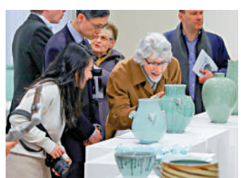
▲2023年4月3日，在比利時布魯塞爾，參觀者觀賞中國瓷器。

本次對話會由中國貿促會與比中經貿委員會共同主辦，兩國政府官員、工商界人士及媒體代表100餘人出席。來自物流、生物製藥等領域的中比企業家代表現場進行了對接洽談。