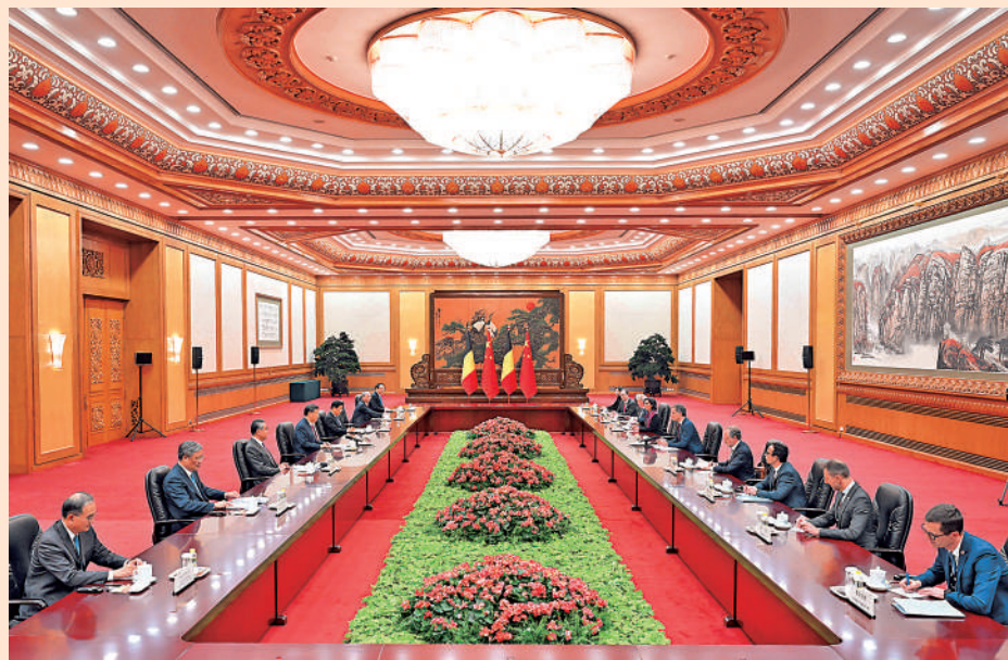
▲12日下午，國家主席習近平在人民大會堂會見比利時首相德克羅。

【大公報訊】據新華社報道：1月12日下午，國家主席習近平在人民大會堂會見來華進行正式訪問的比利時首相德克羅。習近平強調，中國對歐政策保持長期穩定，始終視歐洲為中國的合作夥伴，希望歐洲作為多極世界中的重要力量，發揮積極和建設性作用。面對變亂交織的國際形勢，中歐之間需要架更多的「橋」。中方願同歐方一道努力，推動中歐關係在新的一年裏穩中有進，希望比利時作為歐盟輪值主席國為此發揮積極作用。