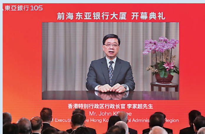
▲李家超表示，香港可為大灣區金融開放創新作出積極貢獻。 ◀前海東亞銀行大廈昨日舉行開幕典禮，東亞銀行視之為大灣區策略樞紐，完善跨境金融服務。

李家超在視像錄影致辭中表示，中央剛於上個月公布《前海深港現代服務業合作區總體發展規劃》，提出要深化深港金融融合發展，提升金融服務深港實體經濟發展水平，不但支持香港經濟社會發展，更提升粵港澳大灣區合作水平。特區政府將帶領各界抓緊前海發展機遇，繼續與廣東省、深圳市、前海管理局等保持緊密合作，發揮香港在「一國兩制」下的獨特優勢，共同推動粵港澳大灣區高質量發展。