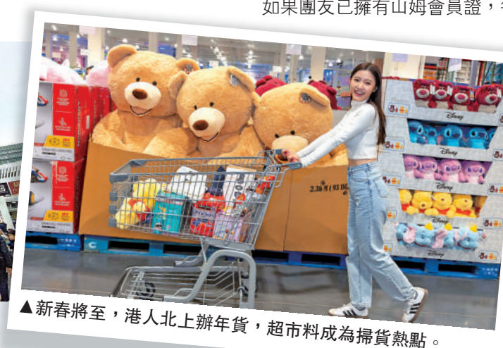
▲新春將至，港人北上辦年貨，超市料成為掃貨熱點。