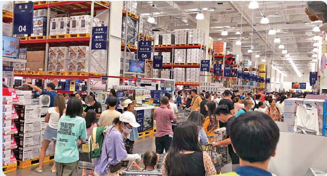
▲港人北上消費成為新趨勢，以會員制形式的倉儲式超市更是熱門之地。