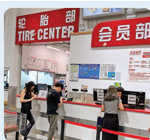
▲Costco以會員全球通用為賣點，近期在深圳龍華區開新店。

中國地大脈博，這些倉儲式超市有多少家？在深圳開設首店的山姆，至今在內地已有47家店舖，單是鄰近香港的深圳便已有3家。經過逾4年在內地的發展，計及新近開設的深圳旗艦店，Costco在內地營運6家店舖。發展相對較遲的盒馬X會員店，截至2023年11月，共設有10家店舖。