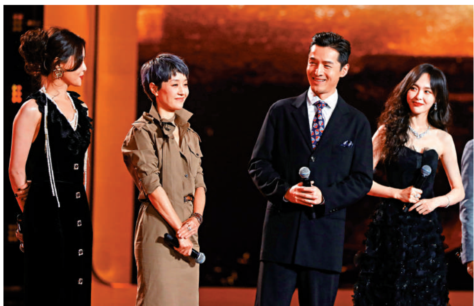
▲電視劇《繁花》主創胡歌（右二）、馬伊琍（左二）、唐嫣（右一）和辛芷蕾（左一）。