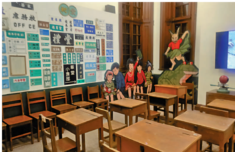
▲沉浸式空間體驗1950年代的天台小學。

展品之外，展覽現場更設有媒體區和沉浸式空間，參觀者可掃描展廳內的二維碼，獲取遊戲和玩具的資料，亦可在展覽特設的沉浸式空間，體驗1950年代的天台小學。