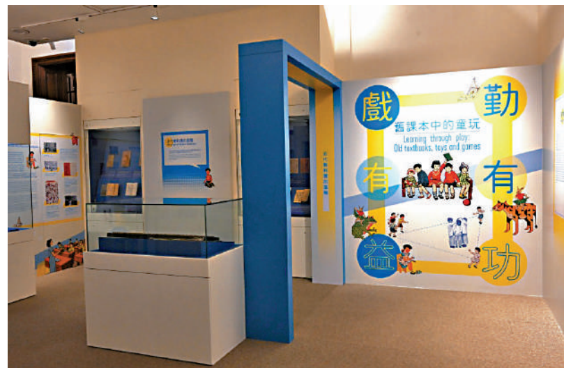
▲「勤有功 戲有益：舊課本中的童玩」展覽現場。