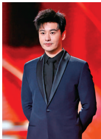
▲演員黃曉明擔任盛典主持人。