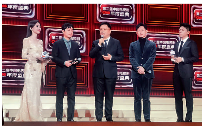
▲《狂飆》劇組主創人員。

2023年開年，《狂飆》先聲奪人，創央視電視劇頻道黃金時段五年以來收視新高，《三體》樹立了國產科幻劇的里程碑，而跨年大劇《繁花》更是映照出奔騰時代裏的赤子雄心，引起觀眾強烈共鳴。此外，《珠江人家》《潛行者》《驕陽伴我》《一路朝陽》等熱播劇表現不俗，受到觀眾好評。