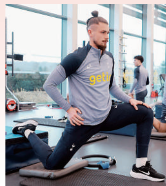
▲達古辛是熱刺剛新增的後衛。