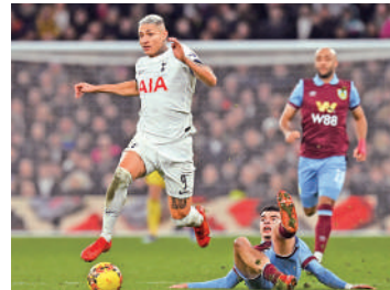
▲熱刺（白衫）回勇，有力挫曼聯。