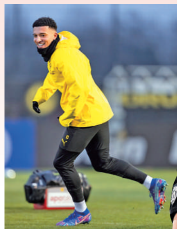
▲與坦帥不和的辛祖已被外借至多蒙特。