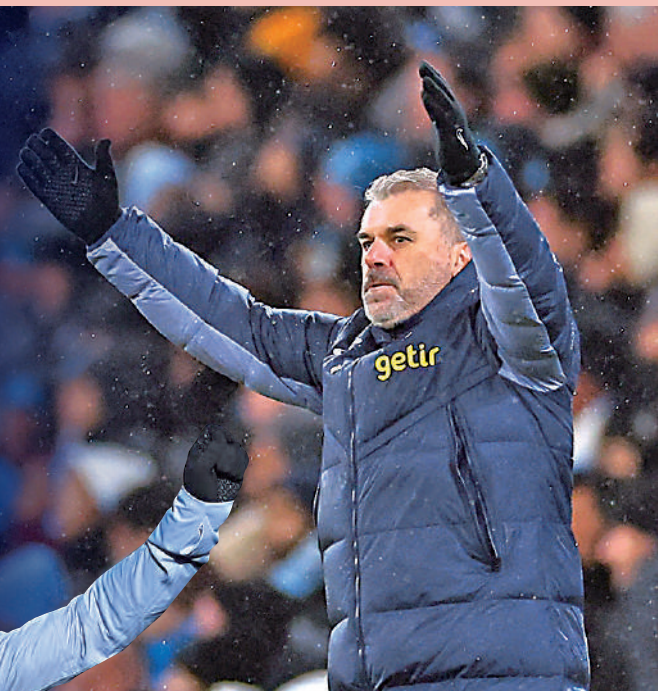
▲熱刺主帥普斯迪高古。