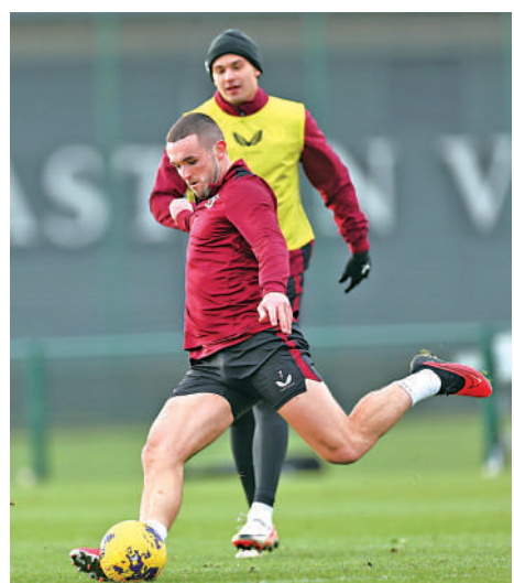
▲維拉近況佳，面對愛華頓贏面高，圖為球員備戰情況。