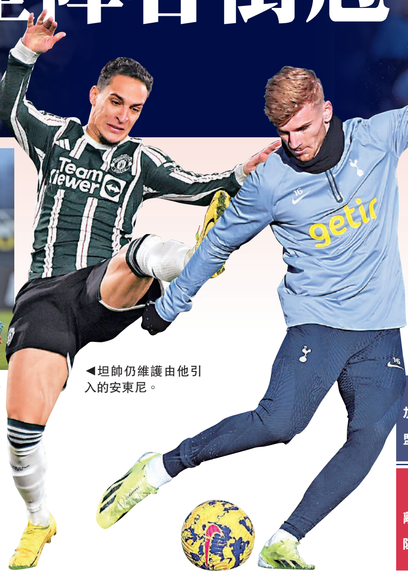
▲坦帥仍維護由他引入的安東尼。