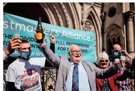
▲2021年4月23日，部分受害者獲英國法院洗脫罪名，在倫敦的法庭外慶祝。