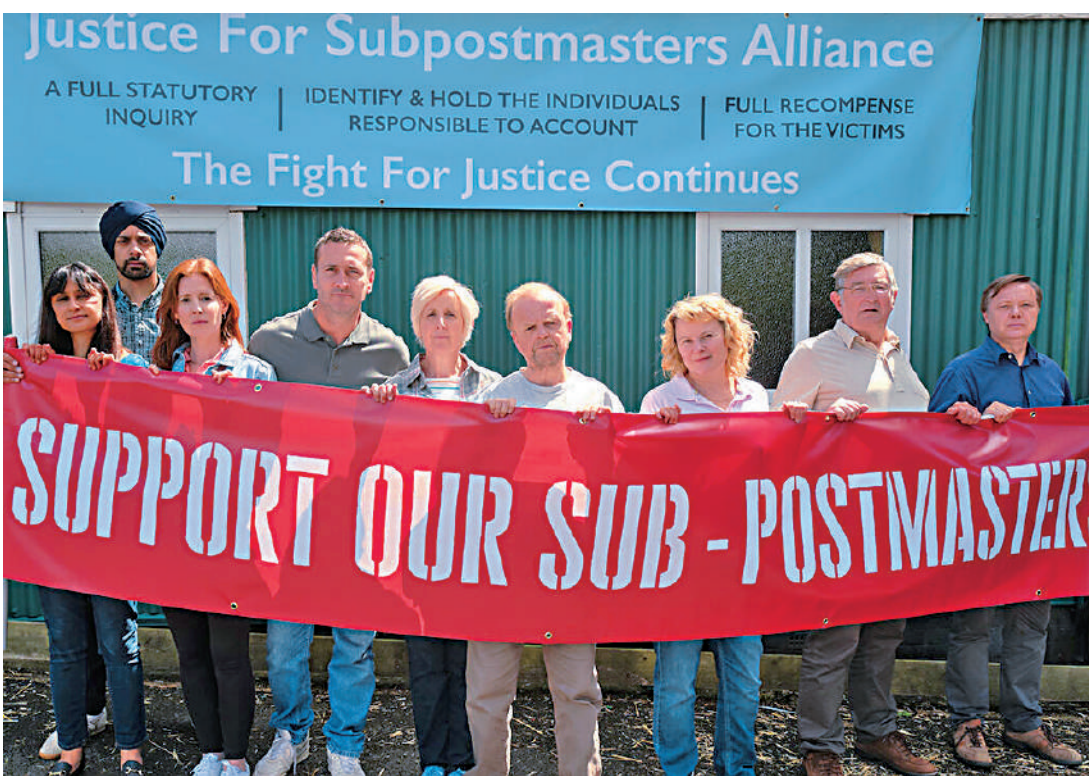
▲英劇《貝茨先生訴郵局案》的演職人員舉起橫幅，聲援郵局冤案受害者。網絡圖片

1999年，英國郵政局（Post Office）安裝啟用由日本富士通（Fujitsu）公司開發的會計電腦系統地平線（Horizon）。英國郵局在全英擁有11500多個分支。不久後，該系統顯示全國多家郵局分支出現資金缺失，涉及數千至數萬英鎊不等。郵局當時的管理層一口咬定「電腦系統不會出錯」，先後起訴900名郵局分支經理盜竊、詐騙和造假賬等罪名。