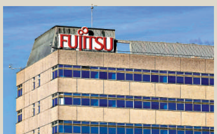
▲日本富士通在軟件出錯的情況下，仍獲得英國政府大量合同。資料圖片

首相蘇納克的發言人表示，正對富士通進行獨立審查，調查期間當局不會採取行動。富士通高管已被議會傳喚，1月16日出席下議院商業和貿易委員會的聽證會。除了英國，2020年10月，富士通的交易軟件故障，導致東京證券交易所系統全天癱瘓。