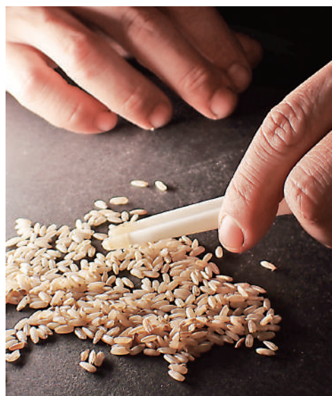
有民間團體希望建立本地米資料庫，做好保育。