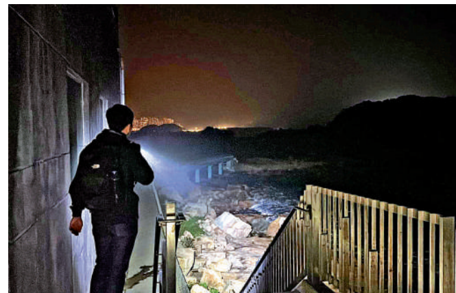
▲警方港島總區聯同政府飛行服務隊展開跨部門聯合行動，以打擊區內爆竊案。

【大公報訊】港島半山區治安一向良好，但因為富戶多，爆竊案時有發生，半山中峽道兩間獨立屋一周內便被連環爆竊，警方港島總區聯同政府飛行服務隊由上周五(12日)起，於港島半山郊區一帶展開跨部門聯合行動，以打擊區內爆竊案。