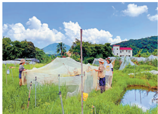
▲團隊默默耕耘漸見成果，成功復育33個本地稻米品種。