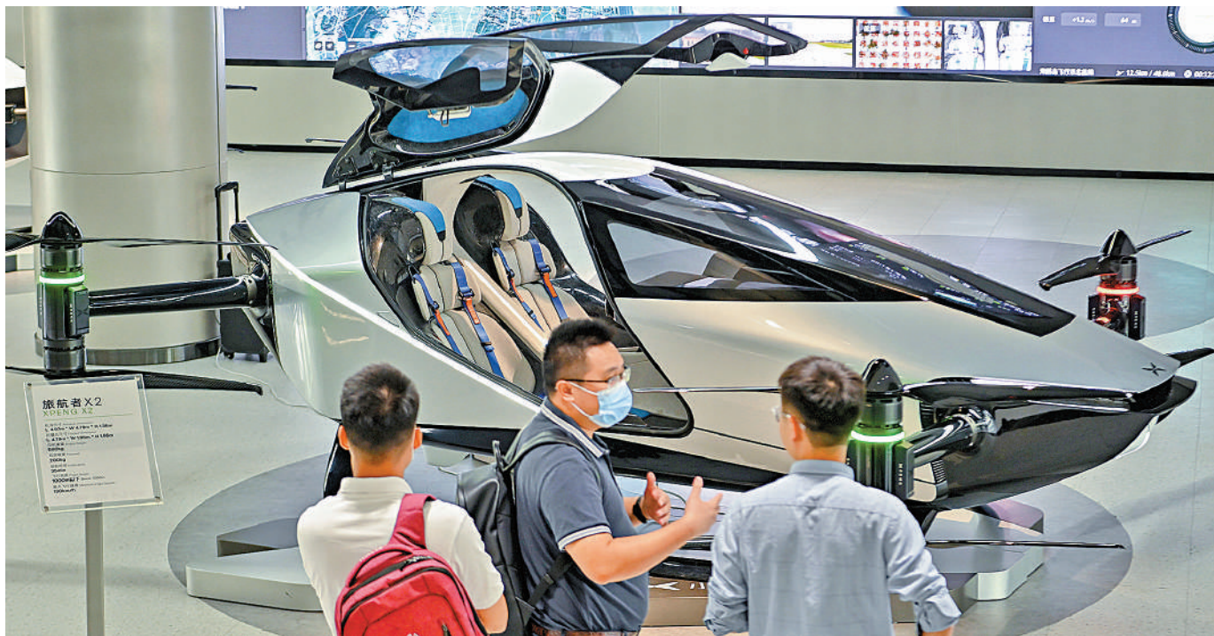
廣州政協昨日開幕，有委員倡發展低空經濟。圖為在廣州拍攝的飛行汽車「旅航者X2」。