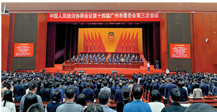
政協第十四屆廣州市委員會第三次會議開幕大會現場。

回顧香港發展史，可知道製造業曾在香港經濟崛起中發揮了重要作用。然而，隨着貿易和金融的發展，香港製造業持續外遷，在很長一段時間裏處於沉寂狀態，導致經濟結構嚴重失衡。為此，近年香港政府不遺餘力推動「新型工業化」，聚焦物聯網、人工智能、新材料及智能生產工序等為基礎，引進適合香港發展的高端製造業。大灣區廣泛的應用場景和強大的科研成果轉化能力，正好為香港提供豐富機遇。