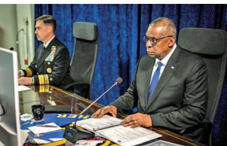
▲奧斯汀14日仍未出院。圖為奧斯汀（右）上月在巴林出席紅海安全峰會。

五角大廈新聞秘書萊德表示，奧斯汀正與高級幕僚保持聯繫，並「繼續監控國防部在全球的日常行動」。奧斯汀的病房已被改裝成安全通訊室，並配備完整的安全和通訊團隊。11日晚，奧斯汀在醫院病房中策劃並實時觀看了美國對也門胡塞武裝的打