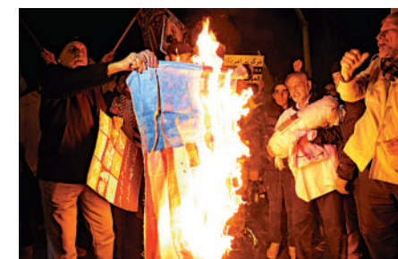
▲伊朗民眾12日在英國駐德黑蘭大使館門前示威，以示對也門的支持。

英國查塔姆研究所中東及北非項目主任瓦基爾說：「我認為伊朗處於有利地位，美國及其在中東的利益已被它將了一軍。」