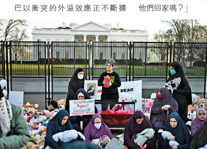
▲示威者13日聚集在美國白宮門前，聲援巴勒斯坦民眾。

海牙國際法院日前就南非指控以色列對巴勒斯坦人實施種族滅絕一案舉行聽證會。內塔尼亞胡13日聲稱，以軍將繼續與巴勒斯坦伊斯蘭抵抗運動（哈馬斯）作戰，包括國際法院在內的任何人都無法阻止。分析人士指出，為減少外界批評和促進國內經濟恢復，以色列將把部分軍事行動轉向「低強度」，但無意盡快結束戰爭。以媒稱，以軍將在加沙北部開展有限度地面行動或空襲，在加沙南部的行動則將集中在汗尤尼斯地區。