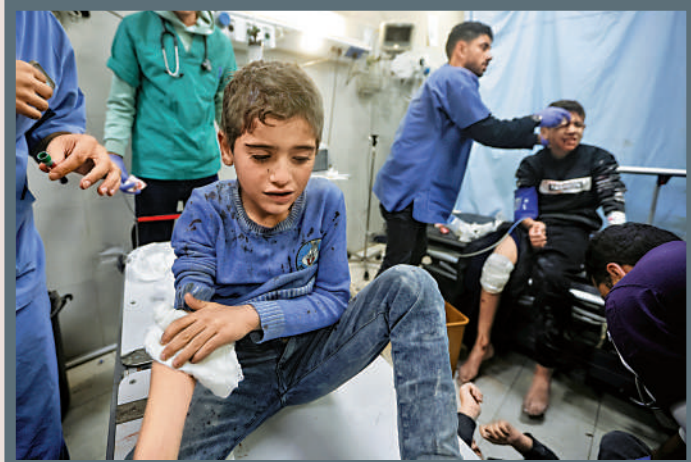
▲因以軍襲擊受傷的巴勒斯坦兒童11日在加沙南部一家醫院接受治療。美聯社

【大公報訊】綜合半島電視台、美聯社、法新社報道：截至1月14日，新一輪巴以衝突已持續百日，加沙地帶約2.4萬人