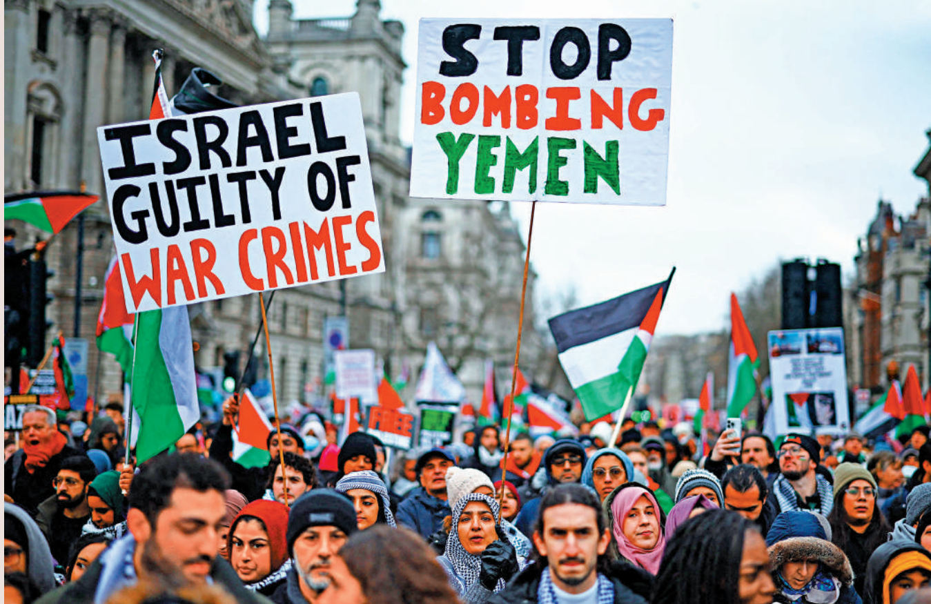
▲英國民眾13日在倫敦參加遊行，呼籲加沙停火，並要求美英停止空襲也門。

在美國軍隊的指揮系統中，國防部長的地位僅次於總統，被視為內閣中最重要的成員之一。奧斯汀的秘密入院引發了對拜登政府安全和透明度方面的擔憂。美國總統拜登在事件發生後一直對奧斯汀表示支持，但承認他在沒有及時說明自己病情的嚴重性一事上「判斷失誤」。