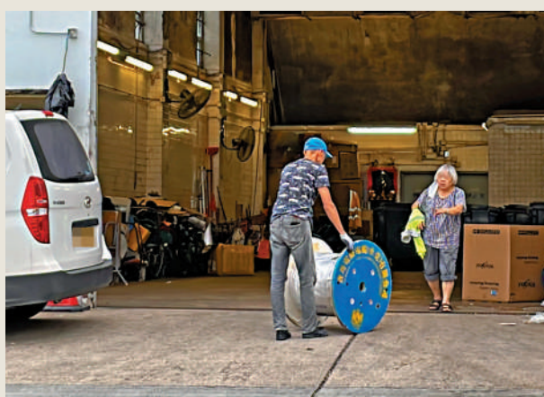
▲一名戴帽男子把一個大線轆推進垃圾站，被清潔工人阻止。