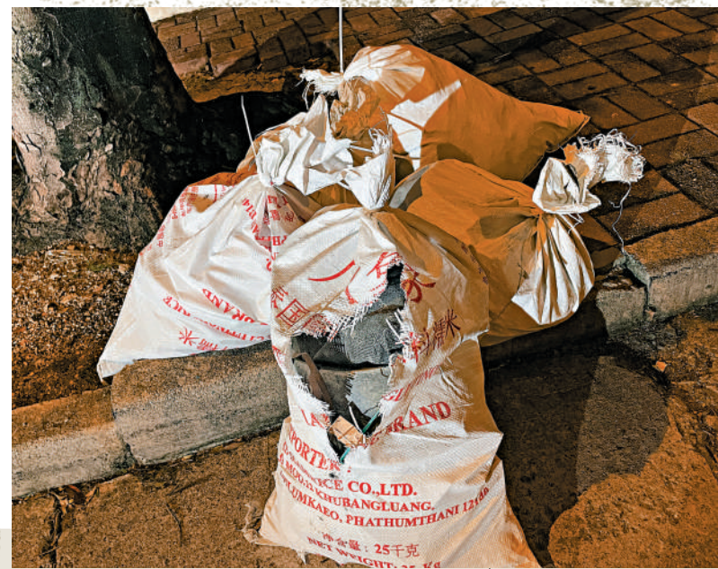
◀一行六人從棚車拿出多袋建築垃圾，試圖棄置在貴州街垃圾收集站內，被垃圾站職員喝止，雙方互相指罵，最終報警調停。