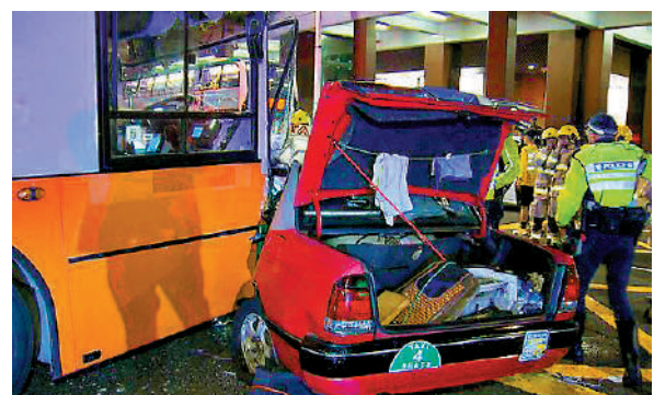
▲一輛城巴與一輛的士在路口相撞，的士上兩名乘客傷重不治。