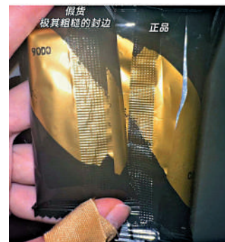
▲有小紅書網友表示從山姆代購手中購得假貨。

若未能在內地旅遊期間解決消費爭議，消費者返港後可向消委會投訴。如涉及香港持牌旅行社代理商安排之購物點，消委會轉介個案至旅遊業監督局跟進；如涉及個別商戶，則會按機制轉介至內地消委會跟進。