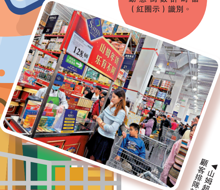
▲山姆超市內，不少顧客排隊試食。