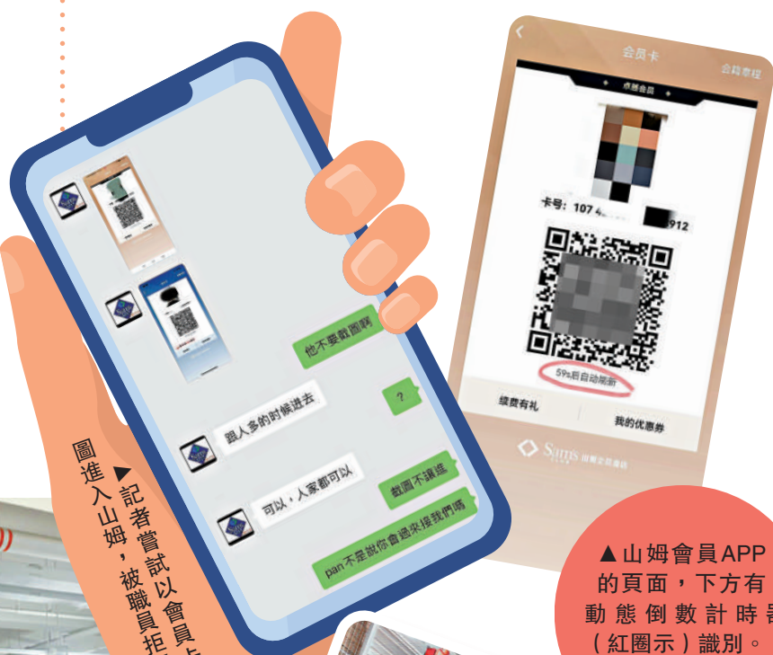
▲記者嘗試以會員卡截圖進入山姆，被職員拒絕。