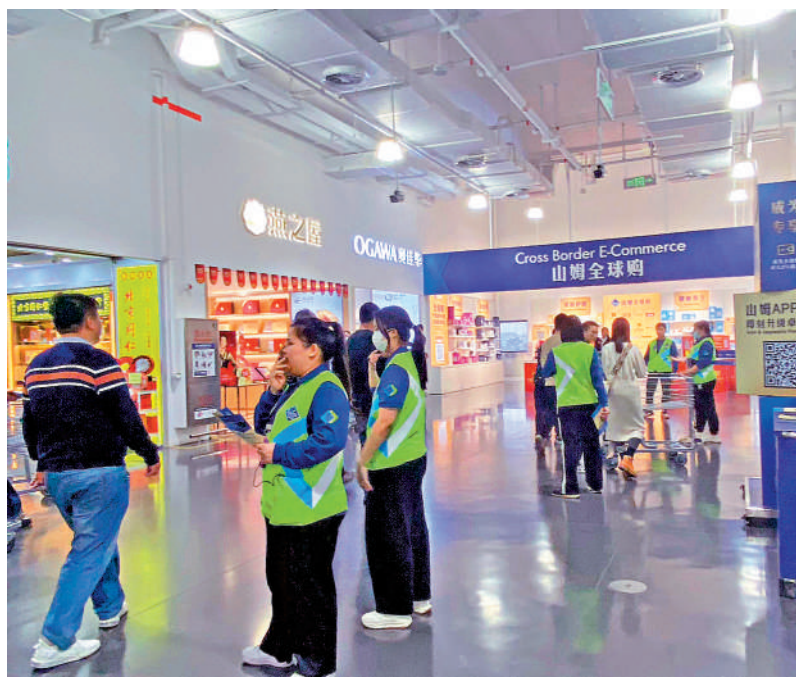
▲山姆超市職員在入口查核顧客的會員資格。