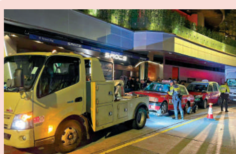
▲警方拖走涉嫌非法改裝的士調查。