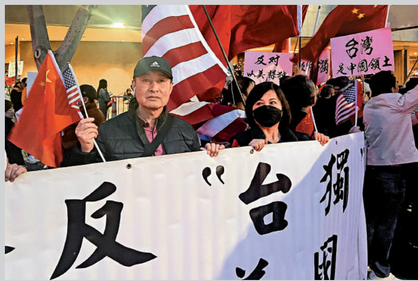
▲堅持一個中國原則已成為國際社會普遍共識。圖為美國華人華僑舉行集會，支持兩岸統一，反對「台獨」。資料圖片

瑙魯政府發布新聞稿，宣告瑙魯與台灣「斷交」，不再同台灣發生任何官方關係，不進行任何官方往來，並表示此舉符合瑙魯人民的最大利益。瑙魯曾在2002年與台灣「斷交」，與中國大陸建交，其後於2005年與台灣恢復「大使級外交關係」。