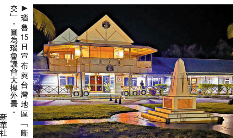
▲瑙魯15日宣布與台灣地區「斷交」。圖為瑙魯議會大樓外景。

連日來，很多國家和國際組織公開重申堅持一個中國原則、反對任何形式的「台獨」、支持中國統一大業，這是國際社會發出的和平之聲、正義之聲。