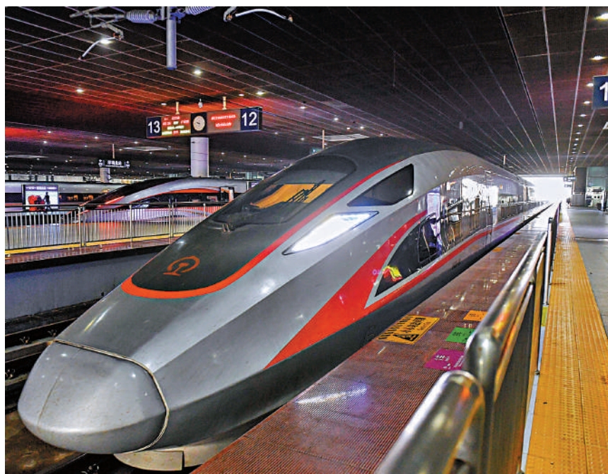
▲高鐵路香港段復通車一周年，去年載客量逾2000萬人次破紀錄，圖為在深圳北站準備開往香港西九龍的列車。