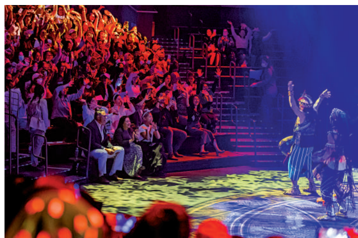
迪士尼樂園與李嘉誠基金會合作，招待四千名外僑到樂園遊玩。

李嘉誠基金會以往曾邀請外僑參加多次活動，包括在2023年1月邀請2.6萬人，包括服務香港的外僑、疫情期間守護香港的醫護及福利機構，免費乘坐「新春幸運摩天輪」及參與嘉年華攤位遊戲；2022年疫情期間邀請2000名外僑觀看電影；以及在2021年包場邀請4000名外僑到海洋公園新開幕的水上樂園。