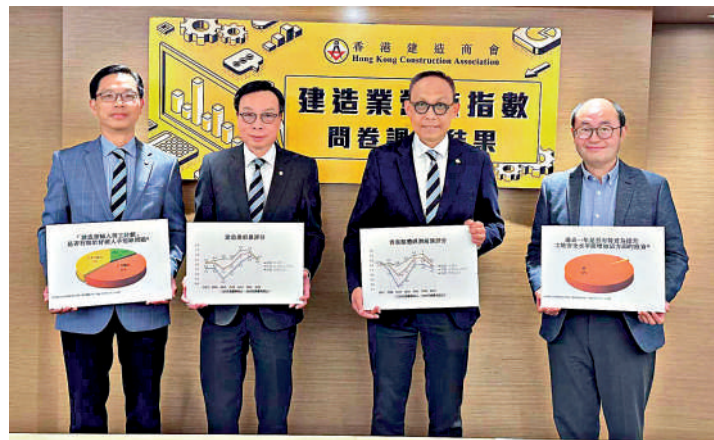
香港建造商會發表建造業營商指數調查結果。

港深高鐵路與東鐵不同，香港至福田全程在地下隧道運行，對外間影響較少，在協調好兩地口岸工作人員安排及維修保養工作後，港深高鐵路可朝着「地鐵化」方向發展，進一步展現潛力。