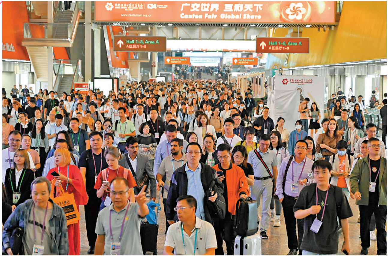
▲廣州去年經濟表現出色，其中2023年廣交會展覽面積、參展企業均創歷史新高。圖為第134屆廣交會現場人潮湧動。中新社