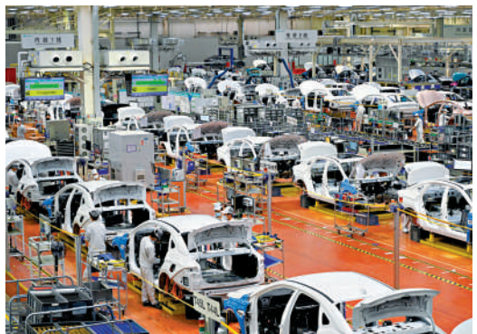
▲在廣州市番禺區的廣汽埃安車間，新能源汽車產業智能生產正酣。

廣州去年經濟表現出色，不僅GDP將突破3萬億，社會消費品零售總額和商品進出口總值亦連續第3年雙雙超過1萬億元，固定資產投資超過8600億元，創歷史新高。新一代信息技術、智能與新能源汽車、生物醫藥與健康產業三大新興支柱產業，亦成長為廣州產業結構中的「中流砥柱」。2023年，廣州戰略性新興產業增加值已佔GDP的30%以上。孫志洋表示，對廣州而言，我們有國家大戰略引領、城市大謀劃布局、市場大空間支撐、投資大項目帶動，正處於發展黃金期、機遇期。