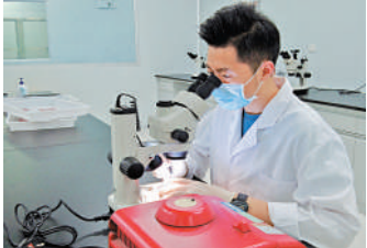
▲廣州一生物實驗室內，科研人員在做研究。