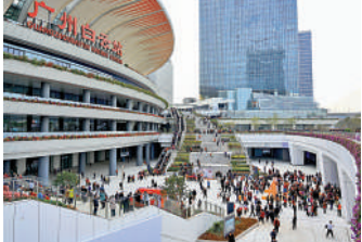
▲去年12月26日，粵港澳大灣區「超級車站」廣州白雲站投入運營。