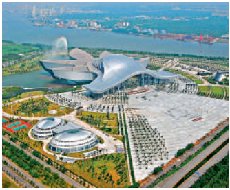
▲廣東科學中心坐落於廣州大學城，科創氛圍濃厚。