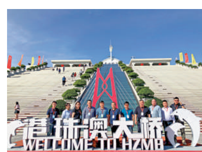
▲港珠澳大橋遊將探索開展港珠澳大橋博物館等服務項目。圖為遊客登上藍海豚島。

據了解，港珠澳大橋遊線路在香港、珠海、澳門三地口岸之間，位於海關監管區和口岸限定區域內，在該區域開展旅遊是全國範圍內首次突破現有政策的創新。大橋遊採用「預約組團、團進團出」的管理模式。而口岸聯檢單位也優化監管設備和流程，採取海關、安檢「一次過檢」聯合檢查，同時也