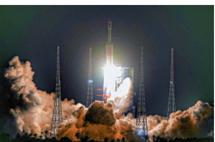
▲1月17日，搭載天舟七號貨運飛船的長征七號遙八運載火箭，在文昌航天發射場點火發射。

長七火箭是中國第一型新一代高可靠、高安全、綠色無污染的中型運載火箭，近地軌道運載能力達14噸，是