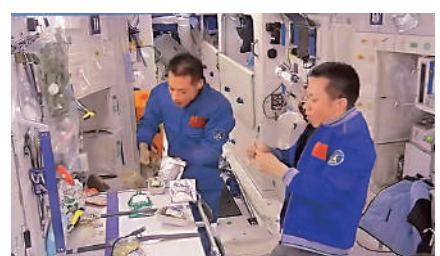
▲神十七航天員正在空間站用餐。

此後，天舟七號還將承擔整個組合體的姿態和軌道控制工作，這樣可以減少空間站的消耗和發動機使用次數，保證空間站的在軌壽命。