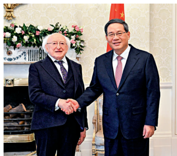
▲當地時間1月17日上午，國務院總理李強在都柏林總統府會見愛爾蘭總統希金斯。新華社

瓦拉德卡表示，中國是愛爾蘭的重要合作夥伴，兩國始終堅持相互尊重、相互信任。愛方讚賞中國經濟社會發展取得的巨大成就，一貫恪守一個中國原則，希望中國早日實現和平統一。愛方願同中方擴大雙向投資，加強農食、創新、綠色發展等領域合作，深化教育、文化等人文交流。愛方願積極考慮為中國公民訪愛提供更多便利，歡迎更多中國企業來愛投資興業。愛方支持進一步深化歐中合作。