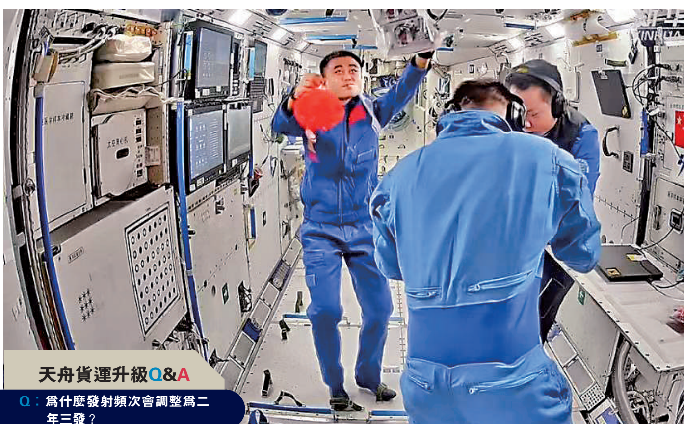
▲日前，神十七航天員在空間站掛上紅燈籠，為即將到來的春節作準備。