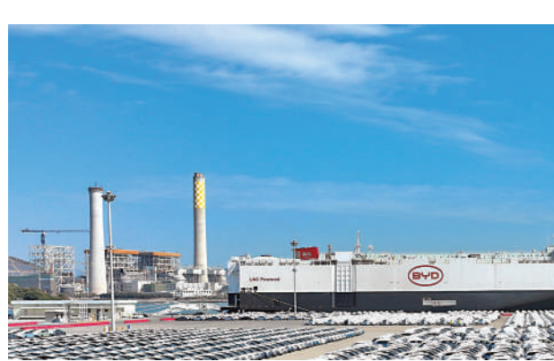
比亞迪力拓東盟市場，且銷售表現較同業為佳。

分析指出，近期比亞迪力拓東盟市場，且銷售表現較同業為佳，因主打經濟型車型受歡迎，而且與當地經銷商合作關係良好。至於比亞迪選中印尼設廠，主因是該國為東盟人口最多國家，中產人數不斷上升，加上當地政府大力發展新能源車。印尼海洋與投資統籌部部長Luhut Binsar Pandjaitan曾表示，印尼正計劃推出一套激勵措施，以吸引電動車製造商投資，市場估計可能考慮取消對投資當地電動車工廠的企業所徵收的進口關稅和增值稅。