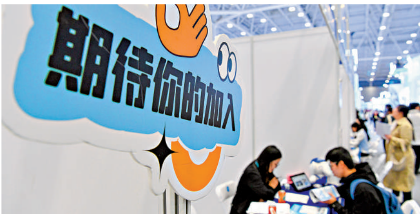
中國經濟活動和勞動力市場持續復甦。