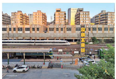
▲高鐵與老火車新舊交替的獨特情景。

過自動感應艙門，抵達巨型環幕環形現場，感受5D裸眼帶來的震撼。這場7分鐘的三趟快車體驗之旅，由北至南，從內地到港澳，從農家到押運員，從山野到餐桌的溫暖記憶，都通過科技的手段讓人身臨其境。一位市民表示，自己曾在三趟快車上工作過，這已經是他第二次來觀看了，感覺很真實。