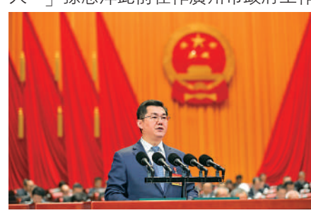
▲1月15日，孫志洋作廣州市政府工作報告。

在當天舉行的媒體見面會上表示：「有幸在這座底蘊深厚、大有作為的城市工作，有機會為2200多萬廣大市民服務，倍感光榮的同時，更深知責任重大。」孫志洋此前在作廣州市政府工作報告。