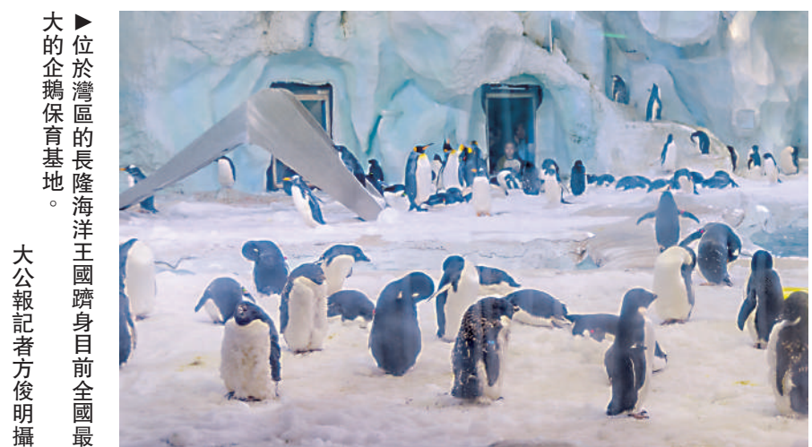
▲位於灣區的長隆海洋王國躋身目前全國最大的企鵝保育基地。

澳門遊客楊小姐說，「其實阿德利企鵝比較好認，牠們嘴黑色，白眼圈，有最萌的色差，以及尾羽比其他企鵝的尾羽稍長，像是一位穿燕尾服的紳士，實在是討人喜愛！」