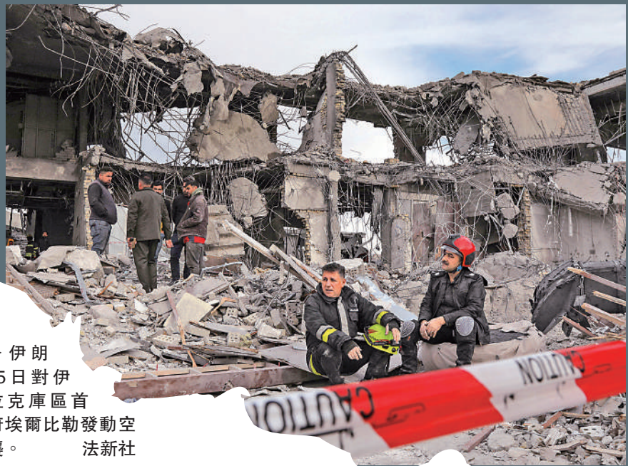
▶ 伊朗15日對伊拉克庫區首府埃爾比勒發動空襲。