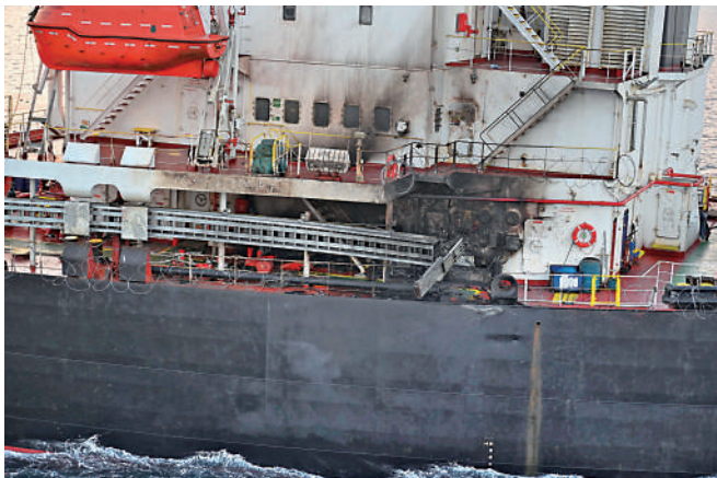
▲ 胡塞武裝18日發射導彈，擊中一艘美國貨輪。

實體，以阻止恐怖分子向其提供資金，進一步限制胡塞武裝進入金融市場，並追究其襲擊往來紅海和亞丁灣