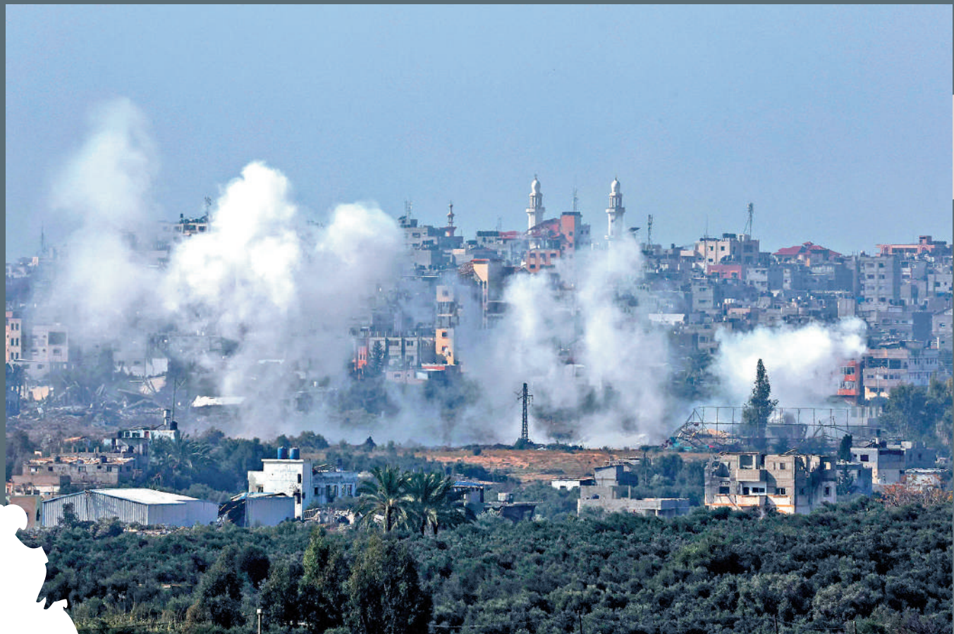
◀ 以色列18日繼續轟炸加沙地帶。