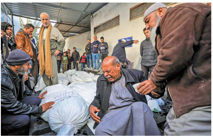
▲ 加沙南部拉法地區的巴勒斯坦民眾悼念遇難的親友。

本月以來，以色列打死多名哈馬斯和黎巴嫩真主黨的領導人或高級指揮官。以色列利用情報和技術優勢，對真主黨高層進行「精準清除」，目的是配合以軍在加沙地帶的軍事行動，重建其情報威懾力。真主黨則展開報復，包括用無人機襲擊以軍北方司令部總部。以色列國防軍總參謀長哈萊維17日表示，在與黎巴嫩接壤的以色列北部「未來數月」發生戰爭的可能性