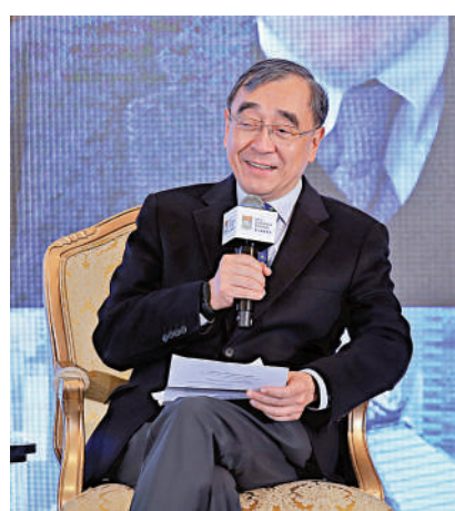
▲王于漸表示，香港將繼續扮演連接內地及國際的重要角色。

Joseph Stiglitz表示，他在1967年首度造訪香港，56年來見證了許多驚人變化，所以至今仍對香港前景充滿信心。他強調，香港具備許多優勢都非常有價值。例如香港擁有多所採用英語教學的大學，這就是巨大優勢，在創新發展趨勢下，大學扮演重要角色，可思考如何擴展與知識相關的產業；另外，對於社會而言，醫療健康行業變得愈發關鍵，特區政府在這兩部分均有部署，而且起到更重要作用，相信可以降低香港經濟對金融的依賴。