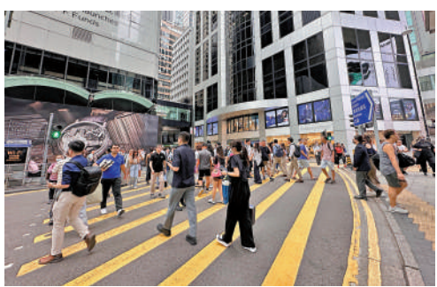
▲2023年10月至12月經季節性調整的失業率，維持2.9%。

勞工及福利局局長孫玉菡表示，勞工市場短期內應會維持緊繃，儘管仍然不利的外圍環境或會有一些負面