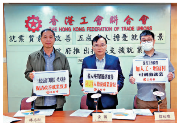
▲工聯會調查顯示，逾七成受訪者認同「加工工、增福利」能刺激就業。

對此，工聯會期望特區政府參考調查結果並對症下藥，推動人手短缺的行業提升薪酬待遇，並在新一份《財政預算案》推出積極主動的措施鼓勵潛在勞動力，尤其是釋放婦女及初老勞動力重投就業市場。