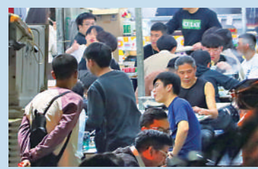
▲「公仔幫」成員近日頻頻於熟食檔出沒，向食客推銷。

香港聾人協會鄧姑娘表示，該中心沒有賣公仔籌款，而籌款之類的慈善活動一定會向社署申請。她又提醒合資格的籌款機構，會在捐款箱貼上公開籌款