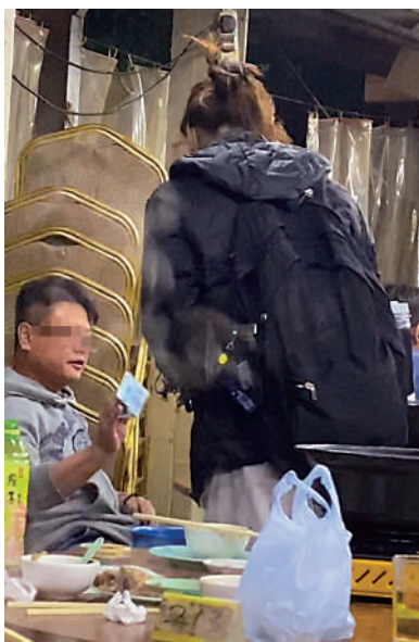
▲有食客不堪「公仔幫」滋擾，掏出20元鈔票打發對方。