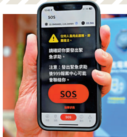
▲「HKSOS」用戶若遇險可透過APP發出專屬求救信號，得到精準的搜救服務。