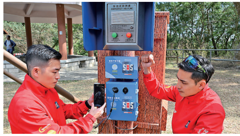
▲「HKSOS緊急站」設有連接到999報案中心及就近警署的按鈕，亦設有緊急充電。