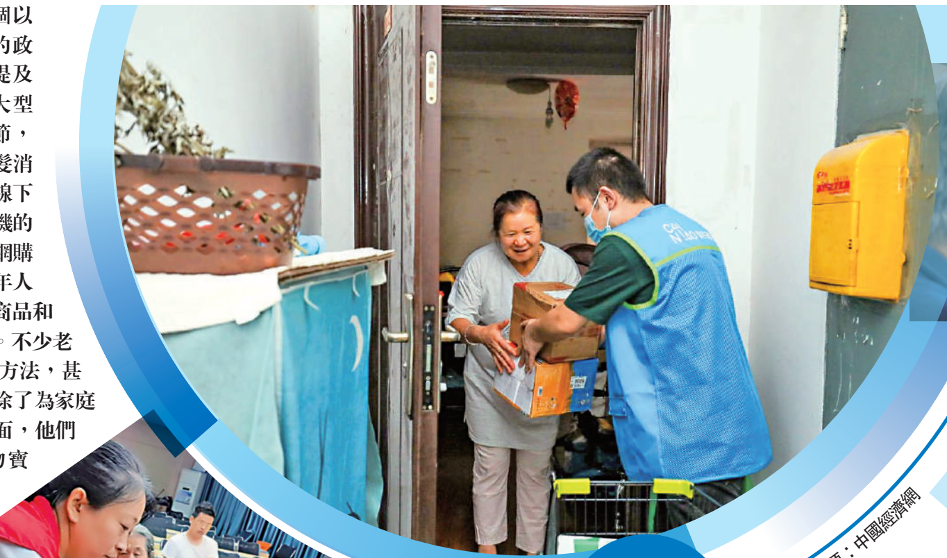
◀內地電商網站促銷期間，快遞員將消費者購買的商品送貨上門。