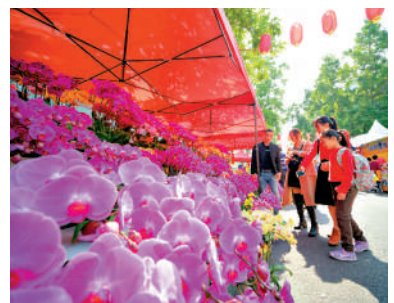
▲春節期間，東莞將推出四條「賞花線路」。