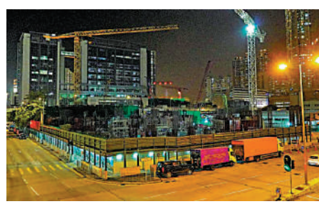
▲長沙灣麗苑苑預計2027年落成。

申請資格方面，申請人須為房委會轄下合資格的屋宇住戶、房協轄下的甲類出租屋邨或長者單位的住戶、持有房