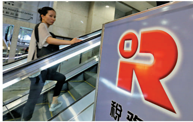
◀適度寬減利得稅、薪俸稅及差餉等等，藉此發揮「撐經濟、紓民困」的重要作用。

期望特區政府積極考慮上述建議，共同推動香港金融服務業向前邁進，增強發展動能，鞏固香港「八大中心」定位，促進經濟持續發展。