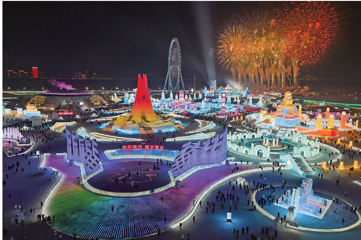
▲哈爾濱冰雪大世界成為今冬熱門旅遊景點。

近來，「爾濱」火了，全國遊客紛紛前往哈爾濱感受冰天雪地裏的火燙熱情。黑土地的質樸和大都市的洋氣、自然風光與人文景致，在這裏交融會通，滲入城市的氣質深層。文學世界裏的哈爾濱同樣是一座魅力之城。作家是城市文學形象的設計師和建築師。對於哈爾濱而言，這位作家是遲子建，正如王蒙說的那樣，「我覺得黑龍江、哈爾濱，有遲子建與沒有遲子建是不同的」。長篇小說《煙火漫卷》讓我們領略了遲子建的哈爾濱。