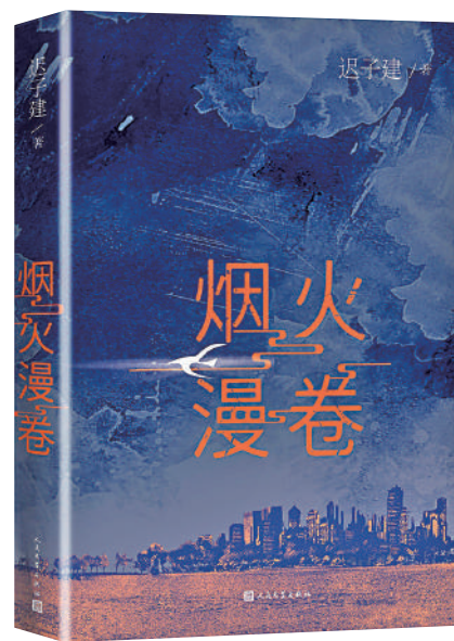
▲《煙火漫卷》，遲子建著，人民文學出版社。