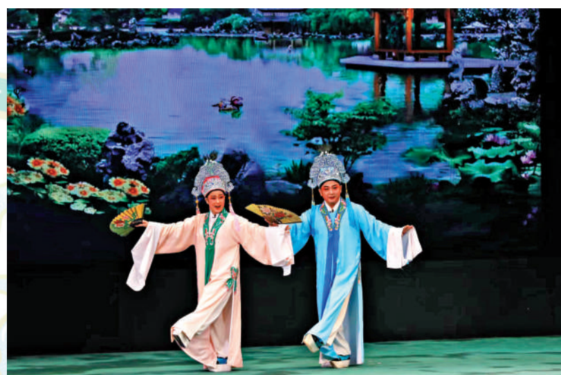
「瓊劇經典永流傳」演出現場。