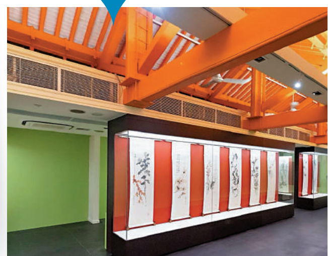
一新美術館展覽現場。