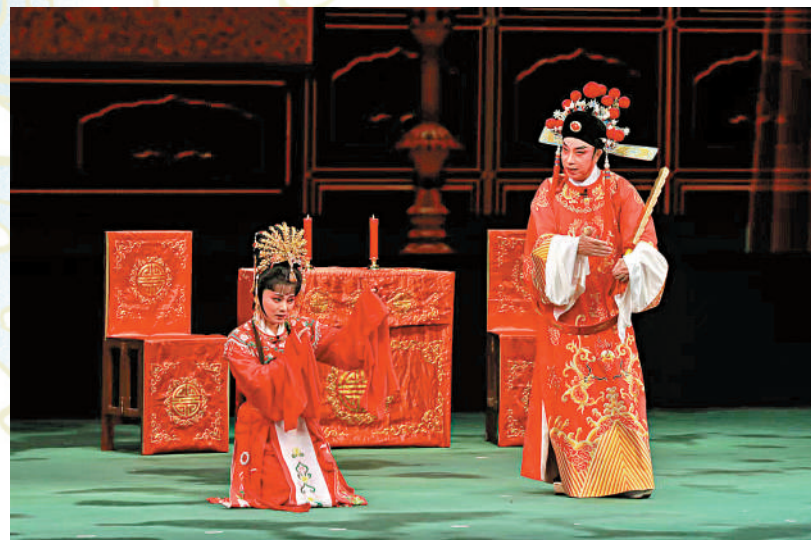
「瓊劇經典永流傳」演出邀請海口海佳瓊劇團訪港。