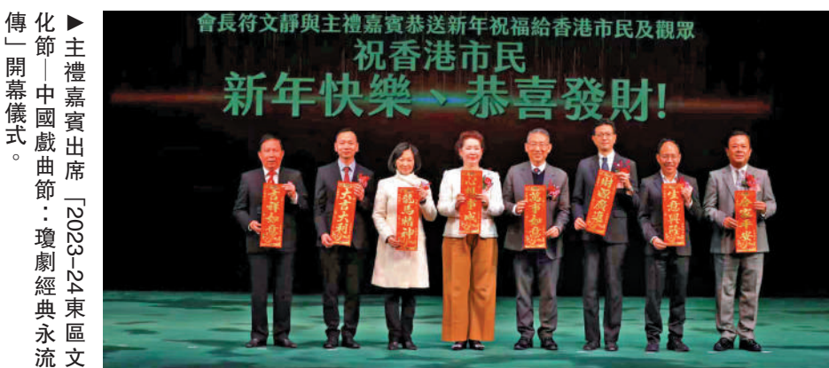
主禮嘉賓出席「2023-24東區文化節—中國戲曲節：瓊劇經典永流傳」開幕儀式。