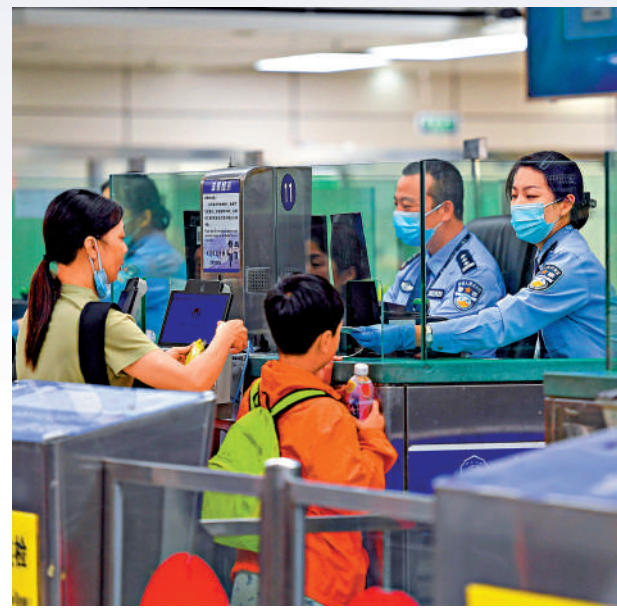
▲深圳灣邊檢站民警為旅客辦理入境手續。