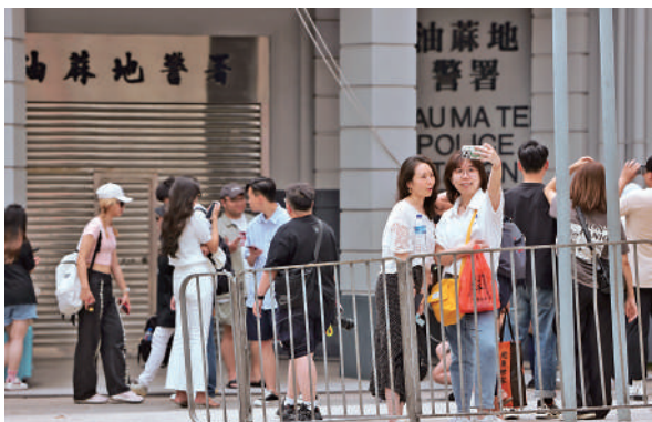
▲遊客在香港舊油麻地警署打卡留念。

24小時通關。例如羅湖口岸和福田口岸屬於鐵路口岸，每天晚上需要停運一定時間開展檢修維護；文錦渡口岸及沙頭角口岸本身口岸通關量則較有限。按照《國務院關於深圳灣口岸啟用時間的批覆》，2007年深圳灣口岸開通前計劃實行24小時通關，考慮通關旅客流量問題，經深港雙方商定報國務院同意暫行6：30-24：00通關，如要推行實施24小時通關，審批手續較其他口岸更為便捷；深圳灣口岸面積117萬平方米，有實施改造的空間，設施設備也較新，可以為實施24小時通關提供較好的基礎條件。