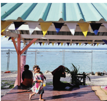
▲璦魯海邊風景宜人。

奧爾森說，作為太平洋島國，璦魯深受氣候變化影響，面臨海平面上升和土地侵蝕等挑戰。一些沿海土地正在被淹沒，