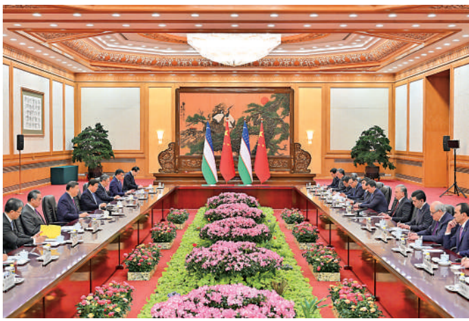
▲1月24日下午，國家主席習近平在北京人民大會堂同來華進行國事訪問的烏茲別克斯坦總統米爾濟約耶夫舉行會談。

【大公報訊】據新華社報道：1月24日下午，國家主席習近平在人民大會堂同來華進行國事訪問的烏茲別克斯坦總統米爾濟約耶夫舉行會談。兩國元首宣布，中烏決定發展新時代全天候全面戰略夥伴關係，在更高起點上推動構建中烏命運共同體。習近平強調，雙方要以發展新時代全天候全面戰略夥伴關係為契機，以高水平政治互信築牢中烏命運共同體的根基，以高質量共建「一帶一路」助力中烏推進各自現代化事業。