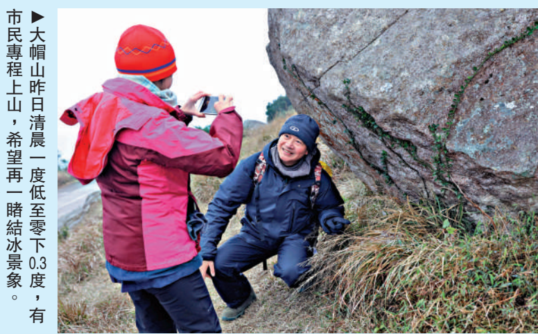
市民專程上山，希望再一睹結冰景象。