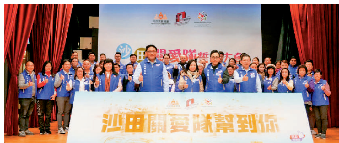
▲沙田關愛隊昨日舉行誓師大會。