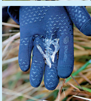
市民的手套上仍留有冰塊。