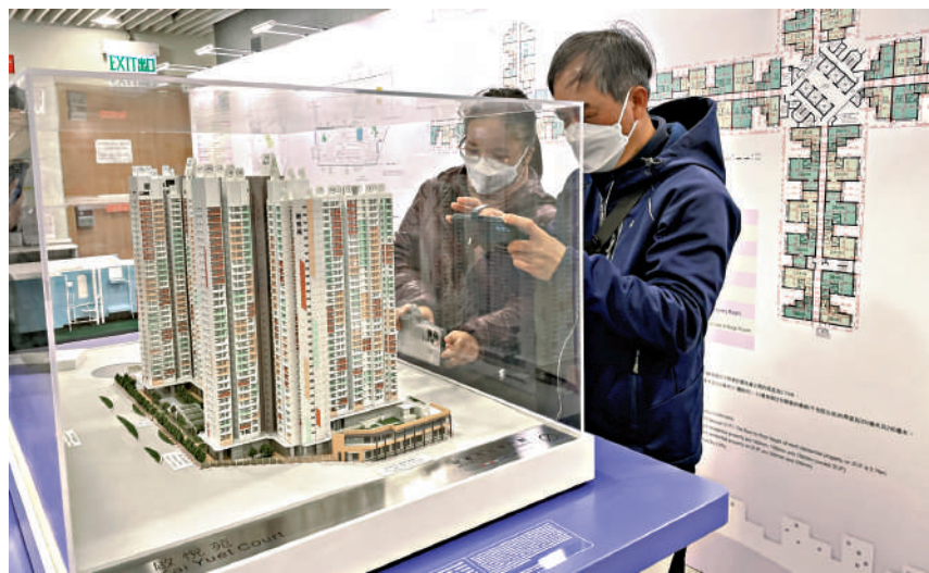
▲居屋價單出爐，不少市民到樂富房委會客戶服務中心拿取樓書及價單，並仔細觀看屋苑模型。

今期居屋合共獲約17.2萬份申請，超額認購約18倍，當中綠表佔約四分之一，白表佔約四分之三。公屋聯會總幹事招國偉預計，地段較好的啟德及單位較大的屯門項目會較受歡迎，但受利率高企和新一期「綠置居」即將推售等影響，今期居屋的揀樓熱度料會下降。但他認為，若綠表的配額未用盡，白表申請者亦可以消化，相信今期居屋不會買剩。