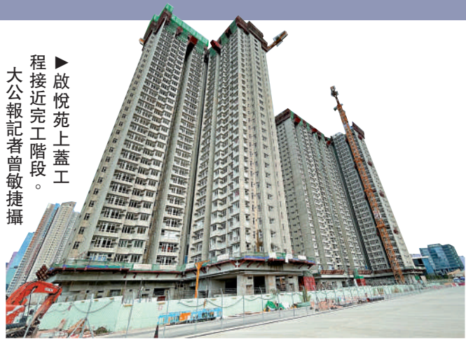
啟悅苑上蓋工程接近完工階段。