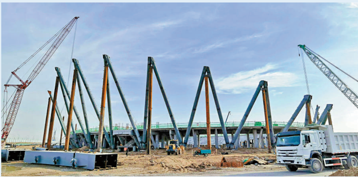
▲過去十年間，中國與烏茲別克斯坦在共建「一帶一路」框架下的合作項目非常多。圖為中企助力烏茲別克斯坦奧林匹克城建設。

中國近日掀起一股烏茲別克斯坦熱潮。北京啟動「烏茲別克斯坦文化日」，新疆烏魯木齊也同時召開「中國—烏茲別克斯坦地方合作論壇」，該論壇甚至還吸引到香港特區政府派代表團參加。究竟烏茲別克斯坦這個國家有何「魔力」，中國如此高調加強與其的聯繫、交流，以及拓展雙方合作機遇？