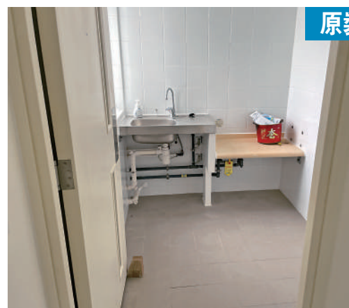
單位廚房及廁所保持原裝交樓狀態，明顯已丟空兩年。