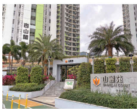
山麗苑兩年禁售期剛過去。

梁文廣又指有類似居屋的新加坡，同樣設有類似的條款，早前揭發有出售的組屋沒有居住，並用以炒賣，新加坡的建屋發展局都會收回單位作懲處。他認為本港的房委會需進一步就有關情況向相關業主作宣傳，若業主購買後沒有居住，一直處於清水樓的狀態，房委會亦要收回有關單位之餘，並需設立舉報機制，加強執法，以收阻嚇作用。