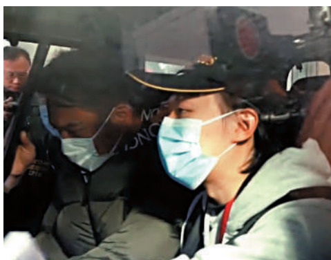
海關拘捕按摩店董事和秘書。

海關跟進調查後，前日(24日)採取執法行動，拘捕涉案按摩店的一名45歲男董事及一名44歲女職員，涉嫌於銷售按摩服務時作出不當地接受付款的營業行為，違反《商品說明條例》，二人現正保釋候查。