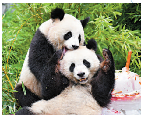
▲在德國出生的大熊貓雙胞胎兄弟「夢想」和「夢圓」。

旅外大熊貓的健康狀況備受關注。張月表示，從檢查評估情況看，各合作機構在場館建設、飼養護理、疾病防治措施等方面總體符合要求，「旅外大熊貓健康狀況總體良好，個別健康欠佳的老年大熊貓也得到了妥善診治和良好照顧」。