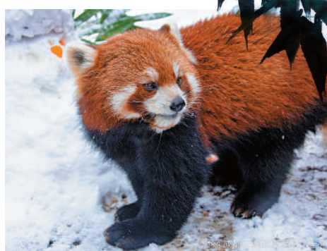
▲成都大熊貓繁育研究基地除大熊貓外也有小熊猫。