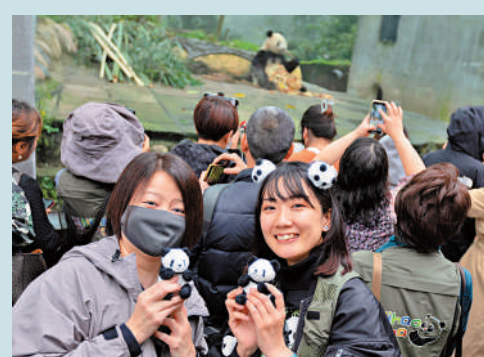
◀去年11月8日，日本「探親團」成員在四川雅安看望在日出生的「香香」。

「攻克人工繁育『三難』初期，僅為了尋找最適合的幼齡大熊貓配乳方，我們就與國外營養學專家溝通了無數次，共同試驗也有幾十次。」中國大熊貓保護研究中心有關負責人記憶猶新。中外雙方的共同努力，讓「萌寶」家族不斷壯大。