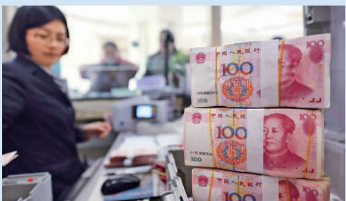
▲人民幣國際化提速，反映中國積極融入國際金融體系。

幣國際化進程，反映中國積極融入國際金融體系，與中國經濟體量相比，全球在人民幣資產及內地資本市場的配置仍有較大提升空間。