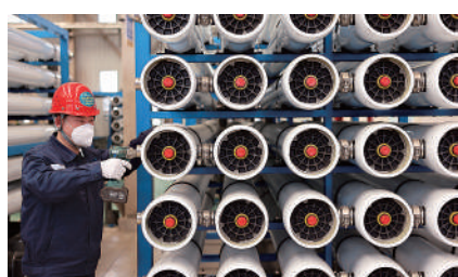
▲中國有很多行業具有巨大發展潛力，並且有相當大的投資價值。

橋水的中國業務僅成立五年，在2018年至2021年這四年間，年化回報率達到15.6%，明顯跑贏滬深300指數同期表現。2023年是不少機構投資者「損手」的年份，但橋水在中國市場的投資表現仍勝過很多同業，回報率高達10.2%，滬深300指數同期卻下跌11.38%。