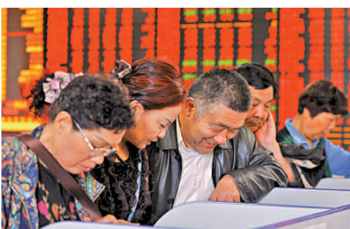
▲滬深兩市昨日4900隻個股上漲，逾百股漲停或升超過10%。