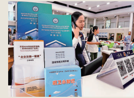
▲前海「e站通」是全國首個提供一站式辦理政府服務的站點。

深化營商環境改革，試點商事登記行政確證制和市場准營承諾即入制，推動港澳跨境電子證照、公證文書等跨境共享應用，打造全球一流營商環境。