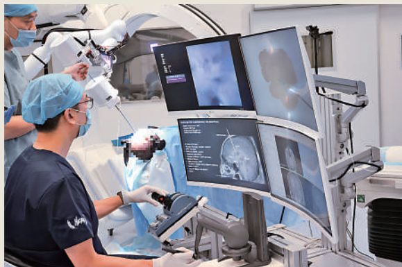
▲人工智能與機器人創新中心研發的安心手術智能系統，核對器械監察流程，減少人為錯誤。

中國科學院於2019年在港設立首家國務院直屬科研機構——中國科學院香港創新研究院。其下設兩大研發中心：再生醫學與健康創新中心和人工智能與機器人創新中心。人工智能與機器人創新中心圍繞新一代人工智能基礎理論、面向健康的智能技術、新型人機交互技術與設備、人工智能開放平台技術開展國際前沿研究工作。其定位是成為世界一流的智能和機器人研究機構。