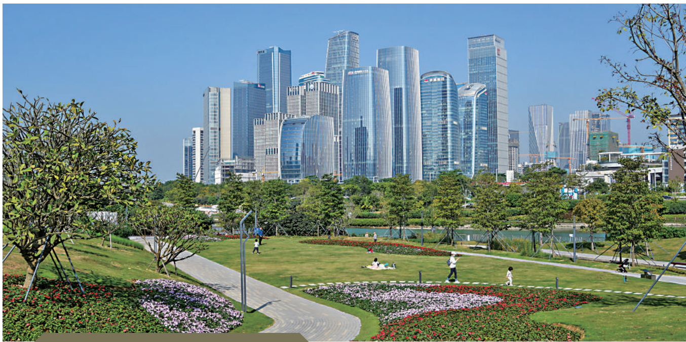
▲前海將打造前海深港現代服務業合作區為深港深度融合發展引領區。圖為深圳前海深港現代服務業合作區。

未來，前海還將深入實施「前海全球服務商計劃」，積極招引、培育細分領域全球前50、國內前20的現代金融、商貿物流、信息服務等八類全球服務商。做優做強前海深港國際金融城、國際法務區、國際人才港，出台支持飛機船舶租賃、跨境電商、供應鏈、人工智能等產業政策，打造風投創投、融資租賃、航運服務、國際諮詢等「6+6」的產業集聚區，加快建設「互聯網+」未來科技城、前海深港國際服務城、海洋新城等。