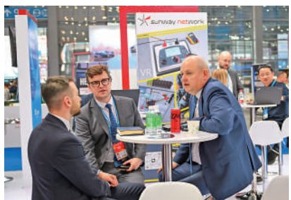
▲在2023年深圳高交會上，客商在波蘭展台上交流。

以自由便利為重點，前海將打造高水平對外開放門戶樞紐。黃曉鵬表示，將穩步推進規則、規制、管理、標準等制度型開放，主動對接國際高標準經貿規則，依託前海蛇口自貿片區加大壓力測試。此外，擴大金融業對外開放，深化前海外商投資股權投資企業（QFLP）、合格境內投資者境外投資（QDIE）試點，拓寬跨境投資渠道。建設好國家進口貿易促進創新示範區，加快建設跨境貿易大數據平台、電子元器件和集成電路國際交易中心。出前海支持大宗貿易貿易的政策，擴大大豆、天然氣等進出口貿易能級，建設大宗貿易貿易集聚區。