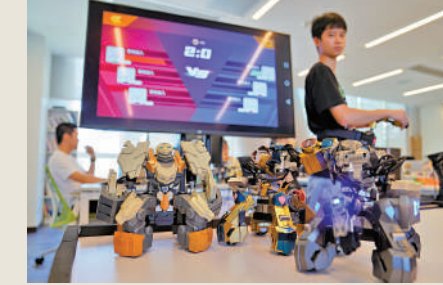
▲前海青年夢工場內科創企業生產的格鬥機器人。

促進民生領域一體化融通，支持港澳青年發展，落實好香港居民個人所得稅政策，實施好港澳青年就業創業發展的12條措施。