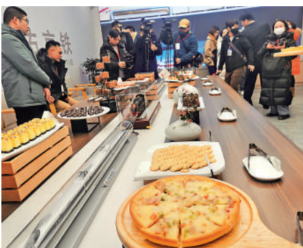
▲旅客可以在高鐵路餐車品嚐到披薩等熱鏈供應美食。