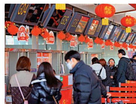
▲1月26日，旅客在天津濱海國際機場排隊辦理值機。