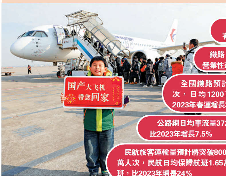
▲1月26日，在上海虹橋機場，小旅客手舉標語牌在國產大型客機C919前合影。