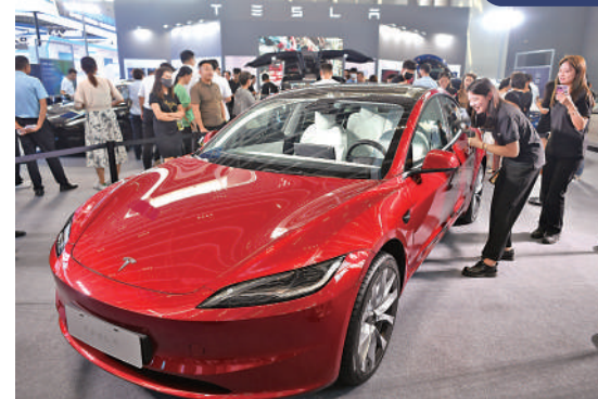
▲去年9月7日，民眾在石家莊一次展會上參觀外企特斯拉的展區。