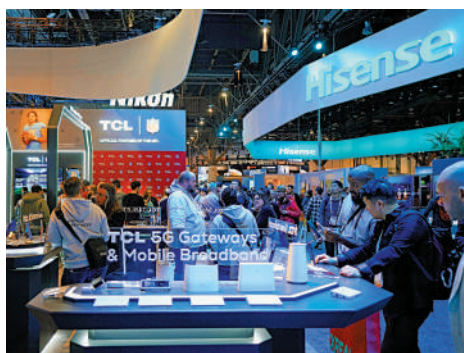
▲1月11日，人們在美國拉斯維加斯消費電子展上參觀中企展台。

他指出，二是加快培育新動能。具體而言，就是向產業要競爭力，依託中國產業基礎完整、製造業門類齊全等優勢，拓展原材料、半成品、零部件等中間品貿易；向創新要活力，促進跨境電商、保稅維修、市場採購等新業態新模式發展；向改革要動力，制定綠色低碳