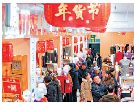
▲1月25日，山西省太原市，一百貨大樓年貨節吸引消費者前來購物。