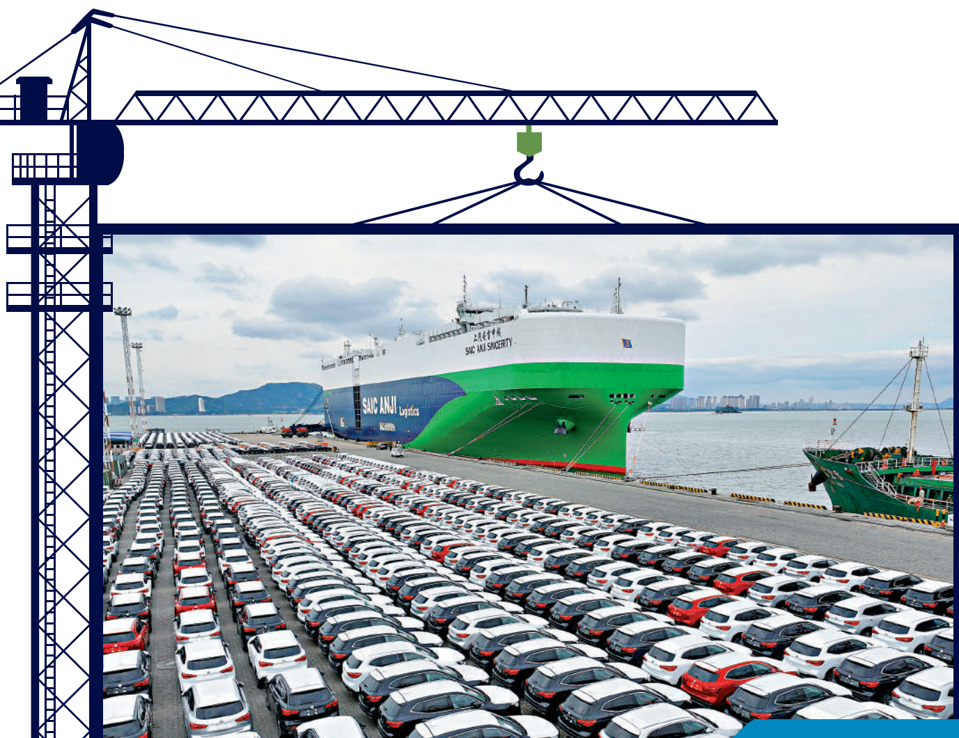
▲23日，3700餘輛汽車準備駛上汽車滾裝船，從福建廈門駛向歐洲。