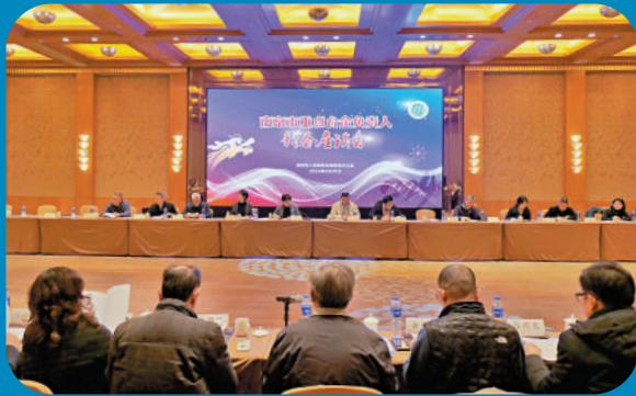
▲1月25日，南京市召開重點台企負責人新春座談會。大公報記者賀鵬飛攝

▶台企艾德克斯電子（南京）有限公司深耕南京20載，成長為國家級專精特新「小巨人」企業。圖為該企業生產車間。大公報記者賀鵬飛攝