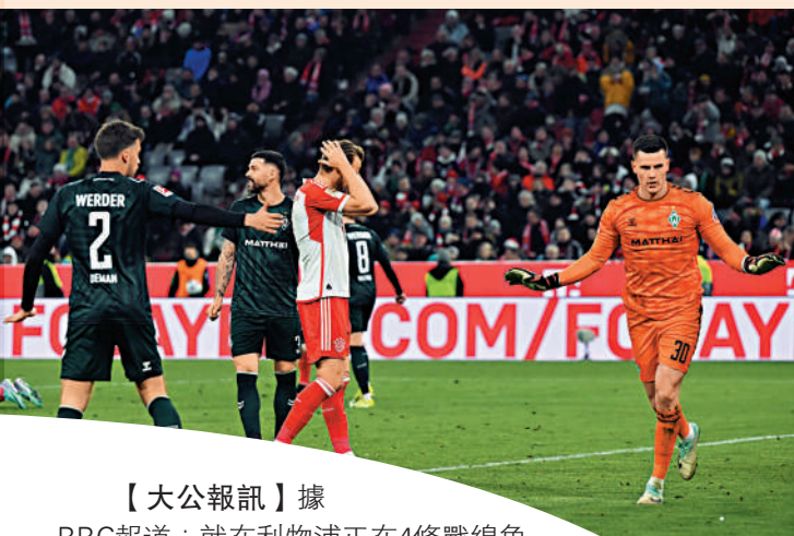
甲負雲達不來梅。圖為前仗德甲。

阿朗素季後必引來各大豪門青睞，剛巧昨天傳來曾效力的利物浦的主帥高洛普將在夏天離開，有資格接手的人並不多，阿朗素應該是能力和聲望兼備的其中一位。 大公報記者譚德龍