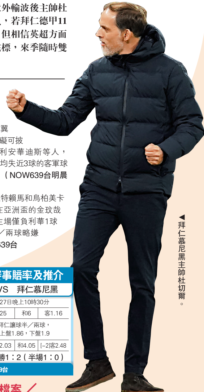
拜仁慕尼黑主帥杜切爾。

拜仁上仗又增添干拉特賴馬和烏柏美卡奴兩防線傷兵，連同仍在亞洲盃的金球哉都缺陣，今晚造訪對上主場僅負利華1球的奧格斯堡，要讓球半/兩球略嫌多，宜敲下盤。(NOW639台今晚10時30分直播)