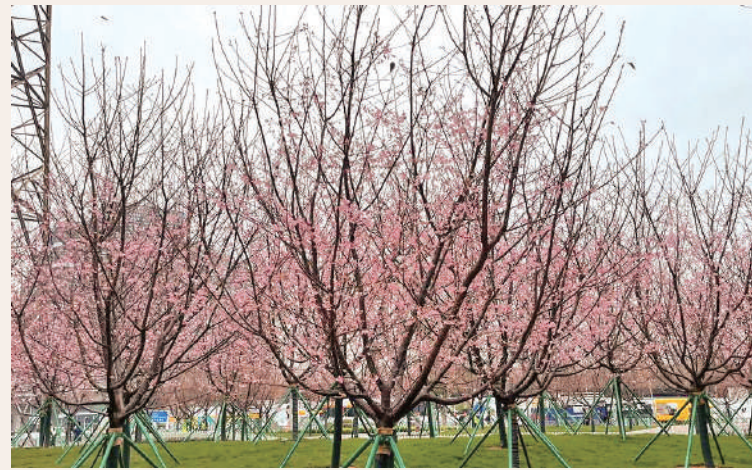
東涌機場島「櫻花園」將於今天起向外開放。網上圖片