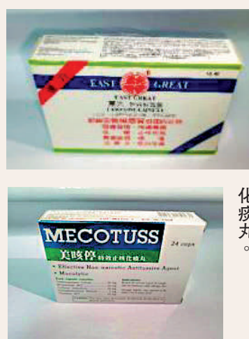
東大速效感冒靈。美咳停特效止咳化痰丸。

署方表示，根據美亞的資料，該些產品曾供應予本地私家醫生、藥房及藥行。美亞已設立熱線電話（2601 2670）解答相關查詢。衛生署會密切監察有關回收。在服用上述產品的市民如有疑問，應徵詢他們的醫護人員的意見，以作適當安排。