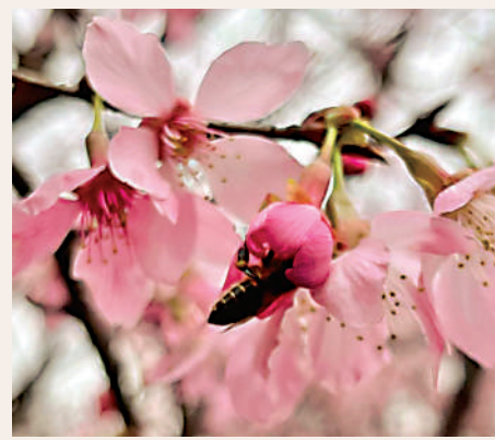
櫻花園一共種有85棵櫻花樹，全部屬「好運來」品種。網上圖片

櫻花園位於東涌赤鱗角南路、觀景山山腳一帶，在東涌站乘車前往需約20分鐘，市民亦可乘搭E線機場巴士，於機場燃料庫站下車，然後沿車尾方向步行並走到馬路對面，轉彎即可到達櫻花園。