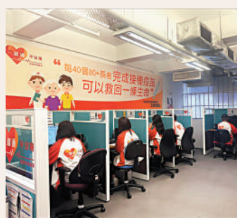
「平安鐘支援中心」已接獲超過七千四百宗求助及四百宗送院個案。

天文台預測今日大致多雲，日間部分時間天色明朗，氣溫介乎15至18度，明日大致多雲，早上相當清涼，日間部分時間有陽光，氣溫介乎14至19度。