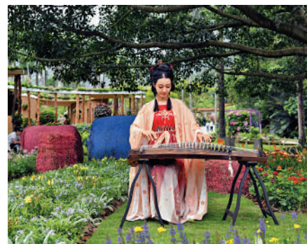
▲仙湖植物園內不時舉行各種活動，例如民樂表演。

仙湖植物園西臨深圳水庫，不少地方都能欣賞到絕美的湖景，湖邊種植的植物品種不同，景色也會有很大的差異。像是棕櫚園，這裏位於仙湖植物園的中心位置，不僅種了各色棕櫚樹，還有玫瑰花和10000多平方米的草坪，放眼望去，一幅春光明媚的樣子。但在水景園區，又是另一番景象。目前岸上的落羽杉已經開始變黃，與邊上的綠色形成了強烈的對比，眺目遠望，層林盡染，彷彿深秋。