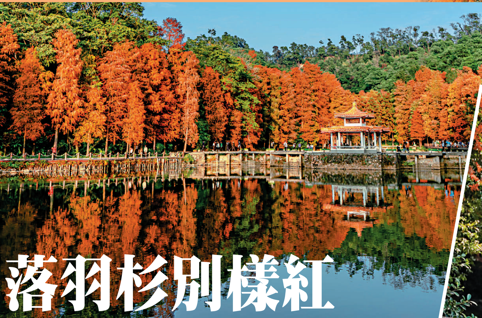
▼落羽杉美景吸引年輕人前來拍照打卡。

►在深圳眾多落羽杉觀賞地中，仙湖植物園因其廣袤的湖水而更為別致，其中水景園是最佳觀賞點。