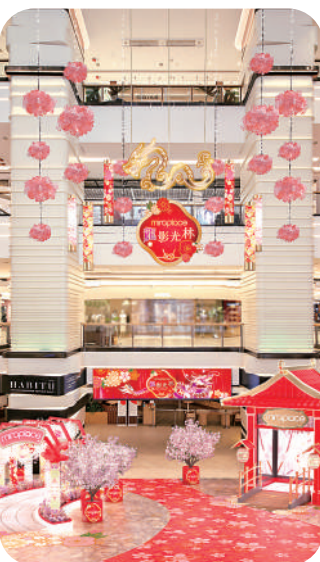
▲ Mira Place絕美打卡熱點「龍影光林」。

香港通關後迎來首個農曆新年，加上適逢龍年（甲辰），各大商場均「搵本」布置商場，並推出不同利是封等吸客。如太古廣場與灣仔星街小區將於本月25日至2月25日，更是以中國傳統園林建築為靈感，運用色彩和花藝，在細節上呈現龍的元素，新裝迎接新春。