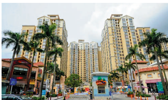
▲書香門第·上河坊樓齡15年，提供1153個單位。