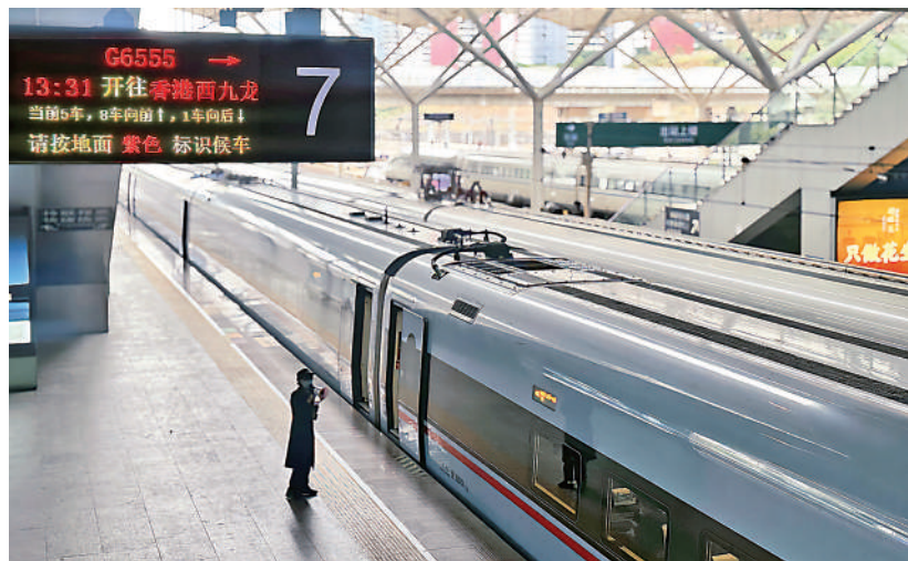
▲由深圳北站搭乘高鐵往香港西九龍站，車程僅19分鐘，快捷方便。