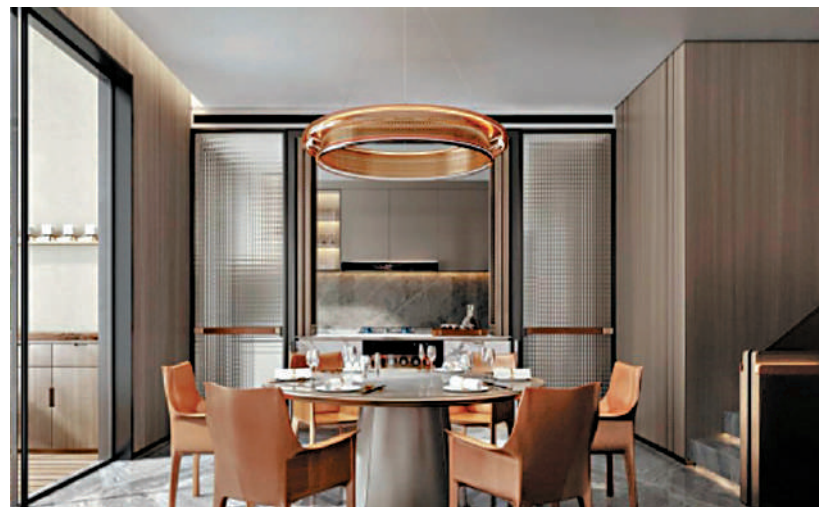
▲溪山君樾全部是大戶型，四房兩廳單位面積由120至173平米。

深圳北站作為深圳最重要的鐵路樞紐，高鐵往香港僅19分鐘，並且與地鐵4、5和6號線交匯，由4號線往福田口岸不到20分鐘，形成深港半小時生活圈，帶動樓盤升值力。鄰近深圳北站的梅林關新盤溪山君樾，環境宜人，鄰近地鐵10號線雅寶站，6站直達福田口岸，受港人追捧，四房戶入場門檻千萬元（人民幣，下同）。