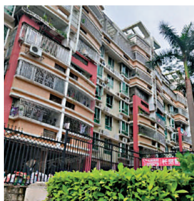
▲萬家燈火為樓梯房，共847伙。

周邊商業配套齊全，附近有永佳平價商場、佳樂超級商場、天潤超市、興萬家超市、民潤超市等，餐廳則有麥當勞、龍門私房菜、新概念小吃店和湘粉人家等，不論是購物消閒，或是外出用膳都十分便利。