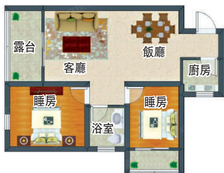
▶書香門第·上河坊71平米兩房兩廳戶型圖。

交通方面，屋苑距離地鐵4號線民樂站僅150米，緊鄰梅觀高速和新區大道。教育方面，附近有民樂小學、民治小學、新華中學等。