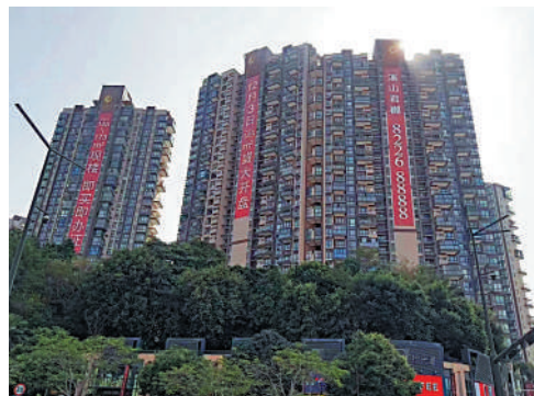
▲溪山君樾是溪山美地園第三期項目，預計今年6月入伙。