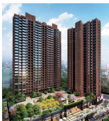
▲新彩苑由3幢物業組成。