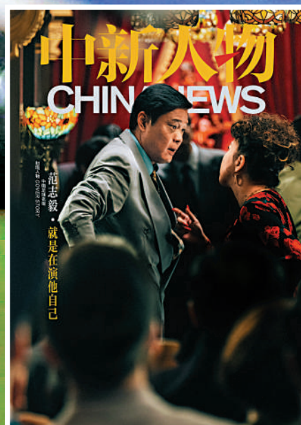
▲ 范志毅因客串《繁花》登上網上中新人物封面，標題寫著「范志毅就是在演他自己」。