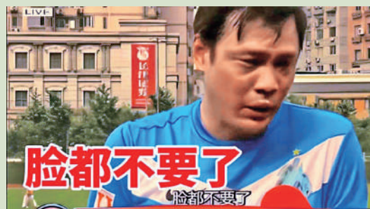
▲ 2013年范志毅(上)痛斥國足不敵泰國後，一句「臉都不要了」成為經典，與《繁花》中的老范話別女主角小汪時「記住，不要給我丟臉」，相映成趣。