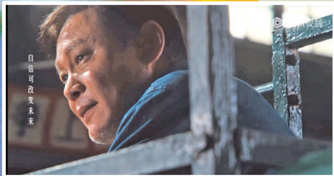
▲ 不少影評稱讚范志毅的內心戲拿捏出色。