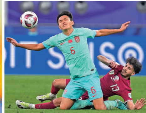
▲ 國足(綠衫)剛於亞洲盃分組賽出局。