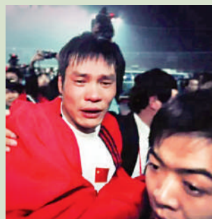
▲ 國足2001年出線世界盃，范志毅賽後哭成淚人。

范志毅在《繁花》其中一幕，與經過歷練後愈發堅強的汪小姐告別的戲分，老范中氣十足地喊着「不要給我丟臉」，眼裏似乎有淚。這段劇情背景音樂是Beyond樂隊的《光輝歲月》，那個經典的男聲唱着「一生經過彷徨的掙扎，自信可改變未來，問誰又能做到。」回首足球生涯，在2006年以36歲之齡退役的「范大將軍」，亦有屬於自己的光輝歲月，更是充滿笑聲與哭聲的交集。