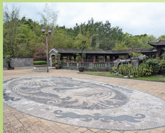
▲有鳳來儀：典故出於《尚書·益稷》其中一句「簫韶九成，鳳凰來儀」，解釋作祥瑞之徵兆。這景點可見地下的鳳凰圖案於正中央。