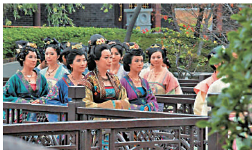
▲《宮心計》曾取景於荔枝角公園。 劇照

入得園中，嶺南之風撲面而來。整個園區涵蓋十景：「有鳳來儀」、「群星邀月」、「橋廊畫舫」、「月起薰來」、「觀雲逐月」、「奕亭殘局」、「溪流影月」、「北門茵綠」、「健康去屐」及「泰然自若」。布局設計，順應嶺南氣候，生活意趣和審美習慣。