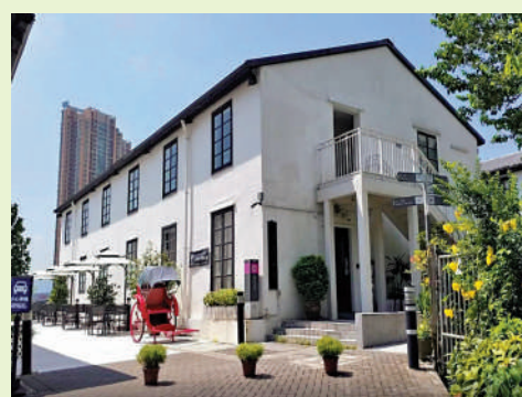
▲饒館內設有文化旅館「翠雅山房」。

前往方法：港鐵美孚站B出口，前行至中華電力變電站，登上行人天橋，左轉至青山道休憩公園，於交通燈處橫過青山道即抵達。