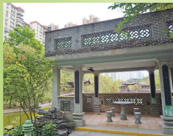
▲觀雲逐月：橫匾寫着「有為臺」，以紀念康有為。內有康有為所撰對聯，樓台上可觀看全園景色。