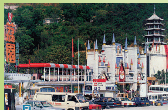
▲荔園曾是香港大型遊樂場。

可惜的是，上世紀90年代，承載人們記憶的荔園遊樂場告別公眾，其所在位置隨後被建成幾座大型屋苑。時光荏苒，「荔園」遊樂場曾在2015年重現香港，以短期遊樂場的形式經營了70天。