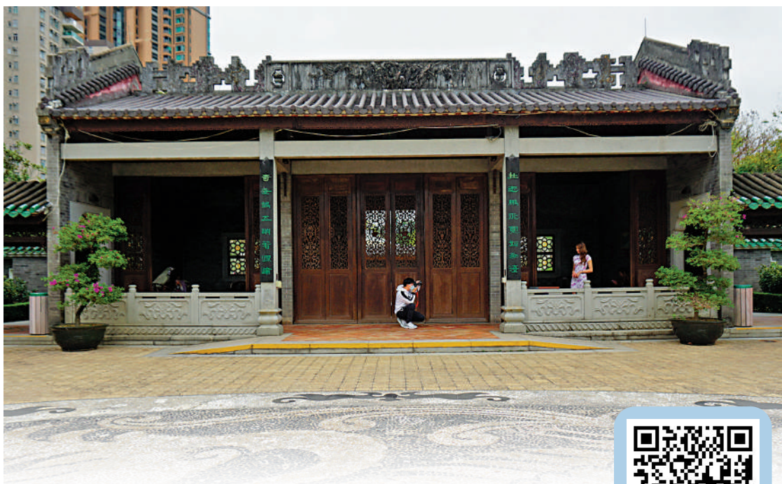
▲荔枝角公園古風古韻，吸引不少人來攝影。