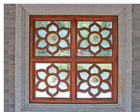
▲「有鳳來儀」旁的古屋內的扇窗。

開始出現在園中夜跑的人群，園內也不乏各類運動場，而到了夜間，園內也不是一團烏黑，燈光照亮建築，也是方便了喜愛夜晚遊園之人，雖然不似白日看得真切，然而萬籟俱寂之時，有夜鷺自水中飛過，心底生出的也是「驚起一灘鷗鷺」的詩意。