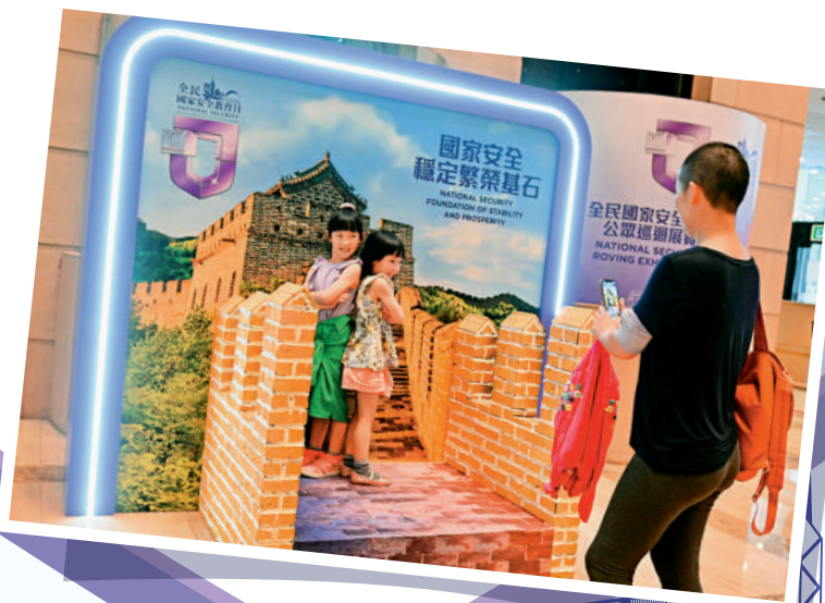
◀國家安全是保障市民美好生活，實現社會更好發展的重要基石。

為了讓香港市民更容易了解，協會將把有參考價值的外國國安法中英文版，陸續放上協會網站，讓市民認清其他國家的做法，不會再像20年前被誤導；同時歡迎研究憲法、基本法、香港國安法的法律界專家學者作為參考資料，一齊向社會大眾解說及推廣國家安全立法的重要性。