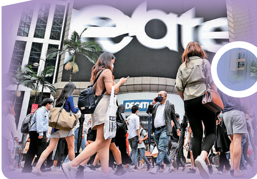
▲社會各界希望盡早為基本法23條立法，堵塞國家安全漏洞。