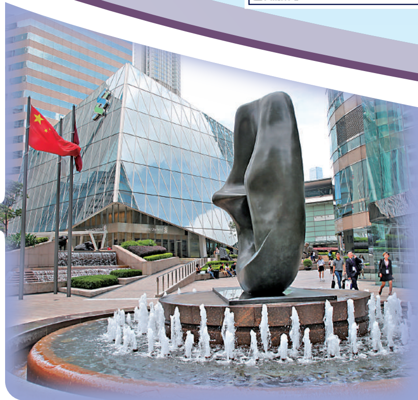
▲23條立法能令本港營商環境更穩定。

全國政協副主席梁振英26日指出，香港應盡快完成基本法23條立法工作，他表示基本法起草委員會與全國人大當年讓香港自行立法已屬讓步。梁振英說，23條「開宗明義」說明香港「應」自行立法，而非「可」自行立法。他說，香港回歸後，《基本法》實施至今已27年，過去由於政治問題未有就23條立法，因此現在需要盡快做。他重申，香港有憲制責任就23條立法，至於具體如何做，相信特區政府與立法會將於適當時候處理好。