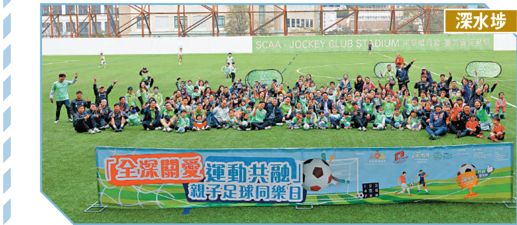
▲深水埗基層兒童和家庭，昨日在銅鑼灣南華體育會運動場參與體育遊戲。