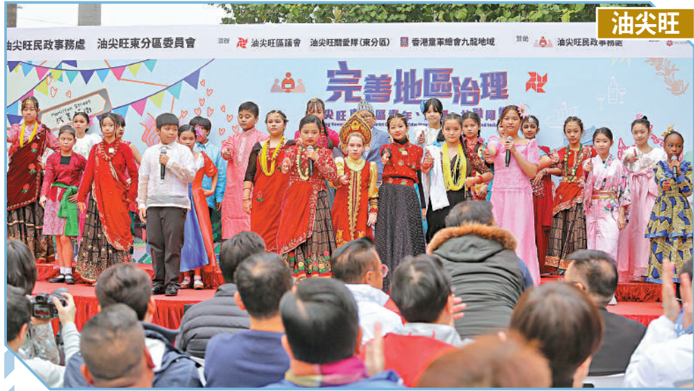
▲油尖旺東分區「青年、關愛、共融」同樂日昨日在文化中心露天廣場舉行。

金融商業： 中西區在科技金融方面是香港的心臟地帶，可以多多舉辦數字經濟、灣區政策及提振香港經濟的論壇，也可以將數位經濟與旅遊結合，做一些AI沉浸式的旅遊體驗。善用中西區的平台推動金融與商業發展，發揮香港國際金融中心的地位。