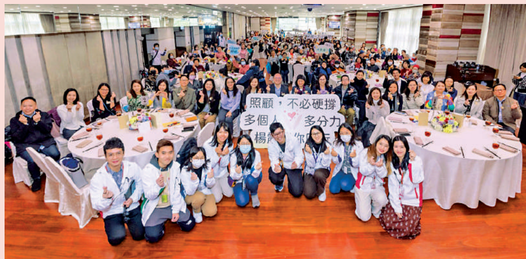
▲循道衛理楊震社會服務處昨日舉行在職照顧者應援團午宴，超過二百人出席。