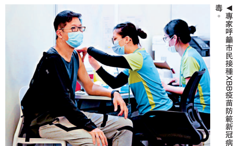
▲專家呼籲市民接種XBB疫苗防範新冠病毒。

衛生署表示，XBB疫苗第二階段接種安排已於本月18日展開，截至26日，已接種約6.6萬劑疫苗。本港現時供應的所有新冠疫苗，庫存足夠應付本年度的預期使用。