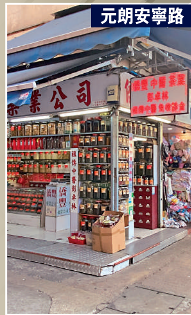
▲元朗安寧路路口轉角一間藥店地台明顯突出。