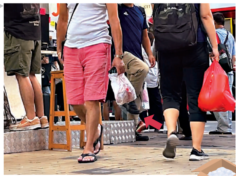
▲長沙灣道基隆街手機店外金屬地台向外延伸，有市民需抬高腿跨過（箭嘴示）。

記者現場觀察，除了極小部分商舖在鋪設的地台旁寫上「小心梯級」的提示字眼外，絕大部分設有地台的店舖都沒有對途人做出任何提示。