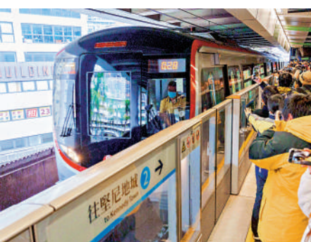
▲逾百名鐵路迷迎接首班Q-Train駛進柴灣站，在歡呼聲中登車拍攝。