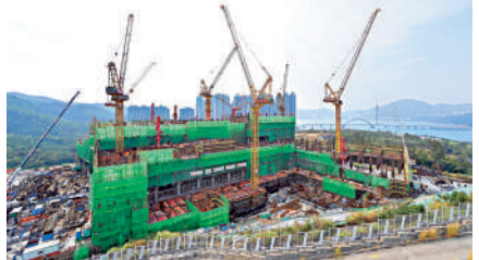
▲位於將軍澳的中醫醫院將於明年底分階段投入服務。

中醫院將成為旗艦，18區中醫診所教研中心將連結成為「衛星診所」。中醫診所的中醫師若發覺病人的病症很複雜，或中醫院有一套很好的治療方案，中醫師可直接將病人轉介中醫院。當中醫院提供住院服務時，可供病人有多一個選擇，例如患有腰椎盤突出的病人，痛到不能下床，不能照顧自己，需要住院治療，