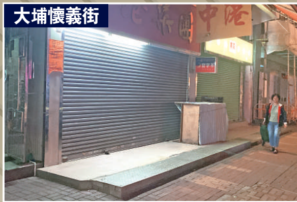
▲大公報記者走訪全港多區，均發現有店舖在門外佔用路面擴建地台，部分用以擺放貨物，令行人路變得狹窄。