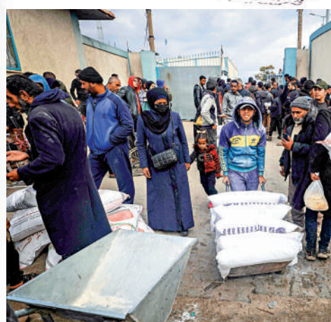
近東救濟工程處28日向加沙地帶的巴勒斯坦人發放食品。