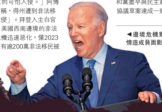
邊境危機對拜登選情造成負面影響。

25個紅州聯署支持得州對抗拜登政府 州長為民主黨人的藍州 州長為共和黨人，但未加入聯署