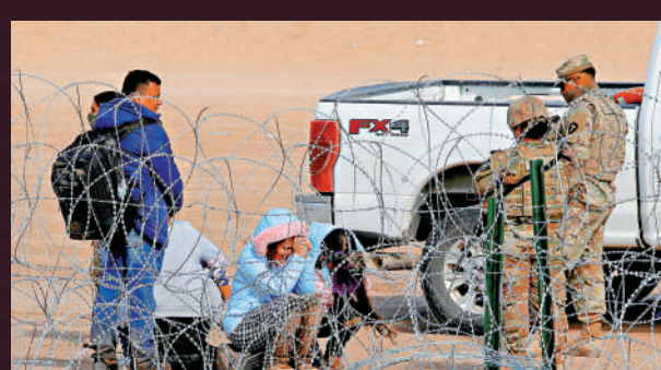
得州國民警衛隊22日攔截非法移民。

移民是保守派選民最關注的問題，共和黨藉此攻擊拜登政府。近期一項民調顯示，僅有38%的登記選民認同拜登的移民政策。拜登26日「服軟」，聲稱將採取更嚴厲的邊境管控措施，試圖避免邊境危機影響其選情。來源：美聯社、CNN