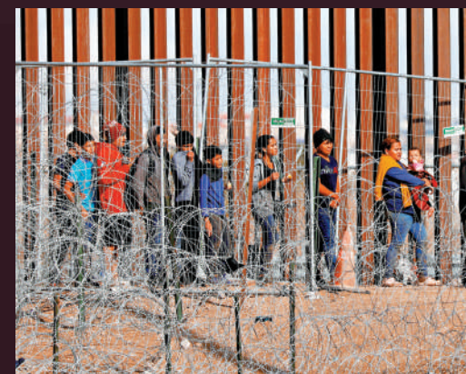
近年湧入美國的非法移民激增，邊境危機成為大選關鍵議題。