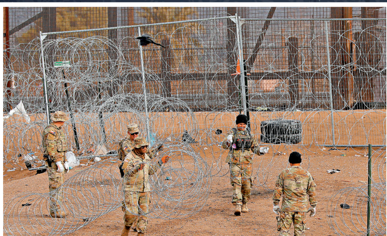
得州國民警衛隊23日在美墨邊境安裝更多鐵絲網，阻攔非法移民。

【大公報訊】綜合美聯社、《新聞周刊》、CNN報道：美國得州與聯邦政府關於非法移民政策的爭端持續升級，導致全美陷入「紅藍對立」，甚至帶來內戰風險。25名共和黨籍州長25日聯署支持得州州長阿博特對抗拜登政府，前總統特朗普27日亦力挺阿博特。阿博特在美墨邊境發起「孤星行動」，建造邊境牆和鐵絲網圍欄阻攔非法移民，近日更派兵控制部分邊境地區，禁止聯邦執法人員進入。今年是美國大選年，共和黨籍移民問題大肆抨擊拜登，指責其未能保衛邊境。