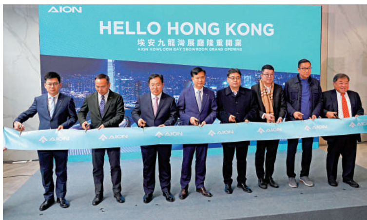
廣汽埃安九龍灣陳列室開業典禮邀請多位嘉賓出席並進行剪綵。

是次典禮還有多位嘉賓出席，包括中聯辦經濟部部長徐衛剛、香港環境事務委員會主席劉國勳等。除新發布的AION Y Plus，發布會上還展覽有廣汽埃安旗下Hyper SSR、Hyper HT、AION ES等車型。