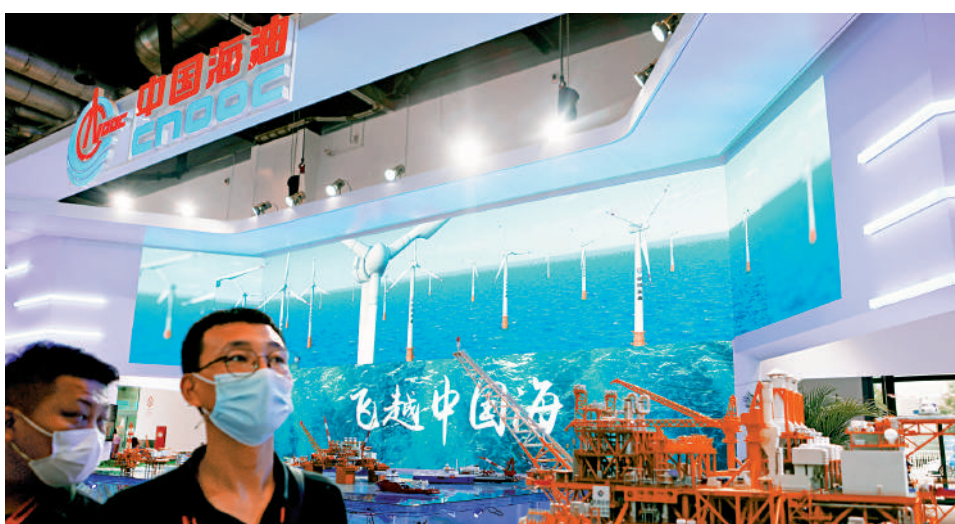
國際油價料逐漸企穩回升，中海油股價有望受惠油價上升。

不過，「中特估」板塊可看高一線，建議可留意中移動 (00941) 及中海油 (00883)